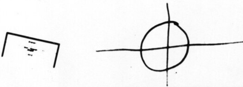
El mensaje conocido como '340 Cipher', enviado al diario San Francisco Chronicle en 1969 por el 'Asesino del Zodiaco'.

H E R > 9 J Λ V P X I ⊙ L T G ⊙ ⊙ N 9 + B φ ■ O ■ D W Y · < ▣ K 7 ⊖ B X E ⊂ M + u z G W φ ⊖ L ■ ⊕ H J S 9 9 Δ Λ J ▲ ▣ V ⊙ 9 O + + R K ⊙ □ Δ M + ⊕ ⊥ τ ⊙ I ● F P + P ● X / 9 ▲ R Λ F J O - ■ ⊙ C ■ F > ⊙ D φ ■ ● + K ⊙ ■ E ⊙ U ⊂ X G V · ⊕ L I φ G ⊙ J 7 τ ■ O + □ N Y ⊕ + □ L Δ ⊙ < M + 8 + Z R ⊙ F B ⊂ Y A ⊙ ● K - ⊕ J U V + Λ J + O 9 Δ < F B Y - U + R / ● ⊥ E I D Y B 9 8 T M K O ⊙ < ⊂ J R J I ■ ● T ● M · + P B F ⊕ ⊙ Δ S Y ■ + N I ● F B ⊂ φ E ▲ R J G F N Λ 7 ● ● ● 8 · ⊂ V ● ⊥ + + Y B X ● ■ E ● Δ C E > V U Z ● - + I ⊂ · ● ⊕ B K φ O 9 Λ · 7 M ⊙ G ⊙ R ⊂ T + L ● ⊙ C < + F J W B I ⊖ L + + ⊖ W C ⊕ W ⊂ P O S H T / φ ⊖ 9 I F X ⊙ W < Δ ⊥ B □ Y O B ■ - C ⊂ > M D H N 9 X S ⊕ Z O ▲ A I K E +