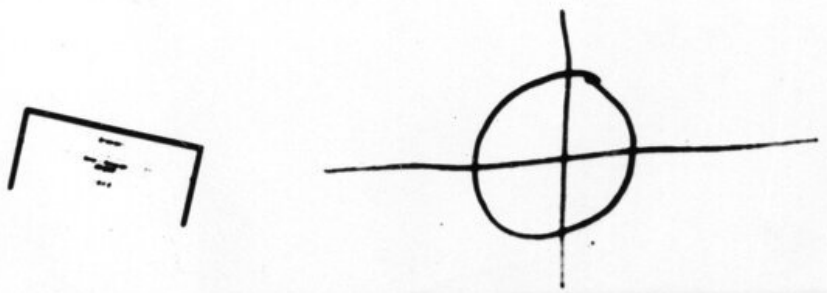
El mensaje conocido como '340 Cipher', enviado al diario San Francisco Chronicle en 1969 por el 'Asesino del Zodiaco'. San Francisco Chronicle. AP

H E R > 9 J A V P X I O L T G O Q N 9 + B φ ■ O ■ D W Y · < ▣ K 7 ⊖ B X E C M + u z G W φ ⊖ L ■ ⊕ H J S 9 9 Δ A J ▲ ▣ V O 9 O + + R K ⊖ □ Δ M + ⊕ ⊥ τ O I ● F P + P ● X / 9 ▲ R A F J O - ■ O C ■ F > ⊖ D φ ■ ● + K ⊖ ■ E ⊖ U C X G V · ⊕ L I φ G ⊖ J 7 τ ■ O + □ N Y ⊕ + □ L Δ O < M + 8 + Z R ⊖ F B C X A O ● K - ⊕ J U V + A J + O 9 Δ < F B Y - U + R / ● ⊥ E I D Y B 9 8 T M K O ⊖ < C J R J I ■ ● T ● M · + P B F ⊕ ⊖ Δ S X ■ + N I ● F B C φ E ▲ R J G F N A 7 ● ● ● B · C V ● ⊥ + + Y B X ● ■ E ● Δ C E > V U Z ● - + I C · ● ⊕ B K φ O 9 A · 7 M ⊖ G ⊖ R C T + L ● ● C < + F J W B I ⊖ L + + ⊖ W C ⊕ W C P O S H T / φ ⊖ 9 I F X O W < Δ ⊥ B □ Y O B ■ - C C > M D H N 9 X S ⊕ Z O ▲ A I K E +