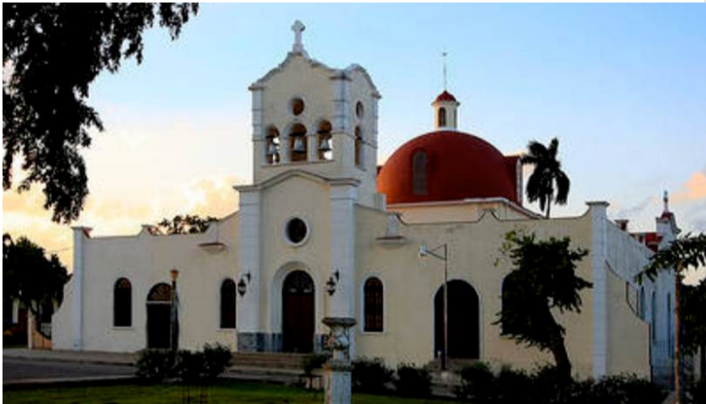
Santuario El Rincón

Al santuario ubicado en las afueras de La Habana , construido junto al hospital donde reciben atención médica personas enfermas de lepra y otras patologías dérmicas, los cubanos lo llaman por el mismo nombre del poblado, El Rincón.