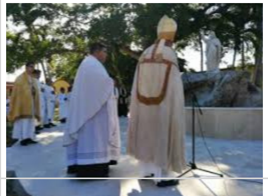
el Papa en la fuente del Rincón