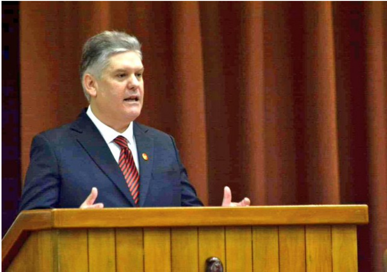
Gil Fernández explicó que para 2021 se proyecta un incremento de 32 mil ocupados en la economía.

La Habana, 17 dic (RHC) El vice primer ministro de Cuba, Alejandro Gil Fernández dijo en la segunda jornada de la sesión ordinaria de la Asamblea Nacional (Parlamento), en su IX Legislatura, que se prevé una recuperación gradual de la actividad económica, con un crecimiento del Producto Interno Bruto (PIB) a precios constantes entre un seis y un siete por ciento respecto al actual calendario.