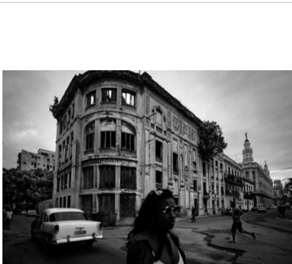
fachada teatro Campoamor

Un derrumbe parcial llevó a su clausura en 1965. Con los años tuvo el humillante destino de servir de parqueo a motos y bicicletas. Ya ni eso. Se deterioró a ojos vista hasta convertirse en una ruina y ahora, cuando se anuncia su restauración, lo único salvable del inmueble es acaso su fachada.