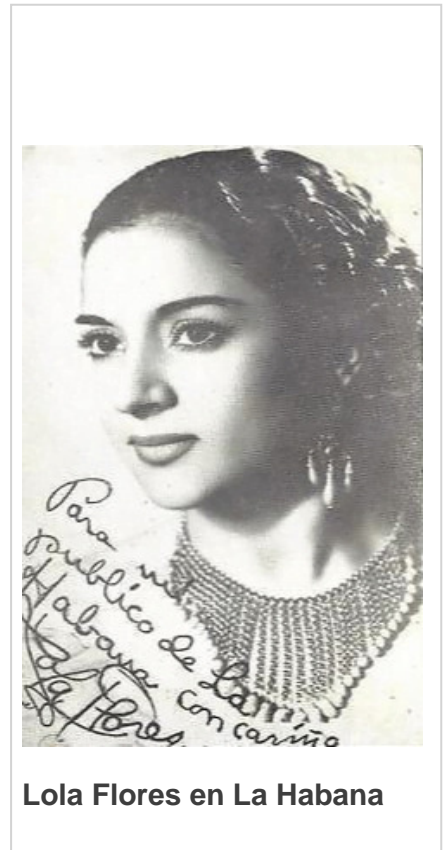
Lola Flores en La Habana

Situado en la céntrica esquina habanera de Industria y San José, a un costado del Capitolio y detrás del edificio del Centro Gallego, hoy Gran Teatro de La Habana Alicia Alonso, el Campoamor, por su ubicación, ha sido siempre punto de referencia en el entramado de la ciudad. Frente se hallaba el hoy demolido hotel Regina, que dio albergue a Alfonso de Borbón, primogénito del rey Alfonso XIII, de España, y Príncipe de Asturias hasta su matrimonio con la cubana Edelmira San Pedro. Muy cerca del Palacio de Cristal, el mejor restaurante cubano de los años 40 y 50, especializado en cocina francesa, y del café donde, en una servilleta y como quien no quiere las cosas, Moisés Simons escribió El manisero, primer gran boom de la música cubana.