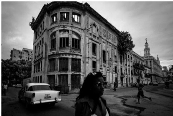
fachada teatro Campoamor

Un derrumbe parcial llevó a su clausura en 1965. Con los años tuvo el humillante destino de servir de parqueo a motos y bicicletas. Ya ni eso. Se deterioró a ojos vista hasta convertirse en una ruina y ahora, cuando se anuncia su restauración, lo único salvable del inmueble es acaso su fachada.