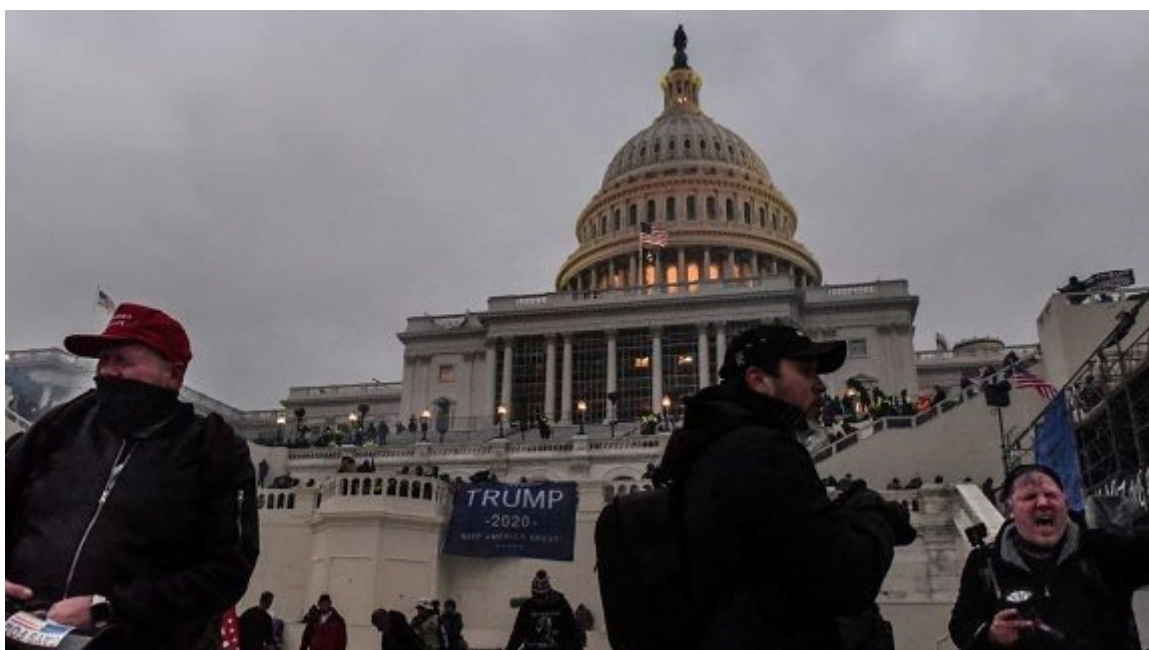
El emblemático edificio fue presa de las acciones de los vándalos.

La Habana, 9 ene (RHC) La Fiscalía del Distrito de Columbia presentó cargos contra un hombre de Alabama que, supuestamente, estacionó una camioneta con 11 cócteles molotov y otras armas cerca del Capitolio el pasado miércoles, el mismo día de los disturbios en el Congreso de EE.UU.