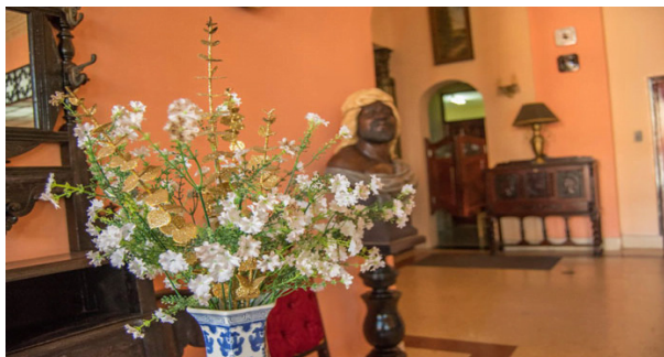
Salón hotel El Globo

En marzo de 1906 un incendio destruye la edificación, el hotel y restaurante se trasladan a un edificio próximo, y no es hasta 1916 que se termina de construir un nuevo edificio de dos plantas en el lugar de origen. El hotel reabrió nuevamente en 1917, hasta nuestros días.