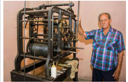
Relojero hotel Globo

Ese anciano reloj, símbolo de la ciudad, aún funciona y es atendido por un vecino de la región, quien cada día sube a verlo, a darle cuerda y a pedirle secretamente que no deje de sonar.