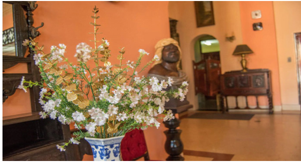
Salón hotel El Globo

En marzo de 1906 un incendio destruye la edificación, el hotel y restaurante se trasladan a un edificio próximo, y no es hasta 1916 que se termina de construir un nuevo edificio de dos plantas en el lugar de origen. El hotel reabrió nuevamente en 1917, hasta nuestros días.