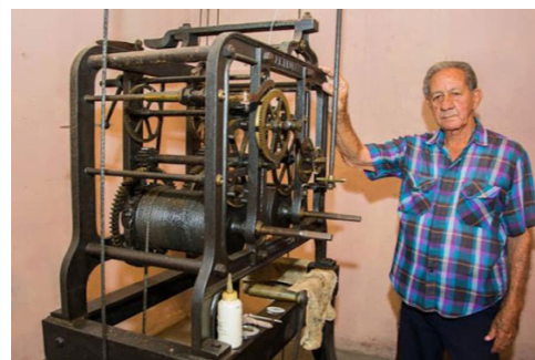
Relojero hotel Globo

Ese anciano reloj, símbolo de la ciudad, aún funciona y es atendido por un vecino de la región, quien cada día sube a verlo, a darle cuerda y a pedirle secretamente que no deje de sonar.