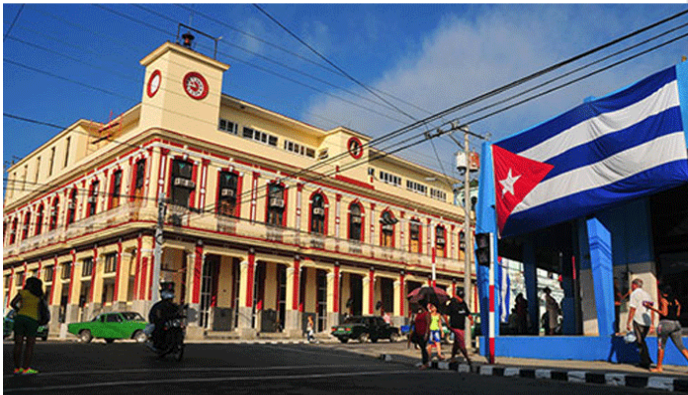
Hotel El Globo