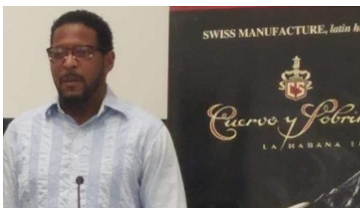
Sotomayor en entrega de Latino Award 2020 Cuervo y Sobrinos

La Habana, 14 ene (RHC) El cubano Javier Sotomayor, el mejor saltador de altura de la historia, recibió en La Habana el premio latino del 2020 de la prestigiosa casa de relojería de alta gama suiza “Cuervo y Sobrinos”, en reconocimiento a su excelsa trayectoria deportiva.