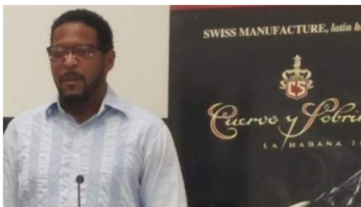
Sotomayor en entrega de Latino Award 2020 Cuervo y Sobrinos

La Habana, 14 ene (RHC) El cubano Javier Sotomayor, el mejor saltador de altura de la historia, recibió en La Habana el premio latino del 2020 de la prestigiosa casa de relojería de alta gama suiza “Cuervo y Sobrinos”, en reconocimiento a su excelsa trayectoria deportiva.