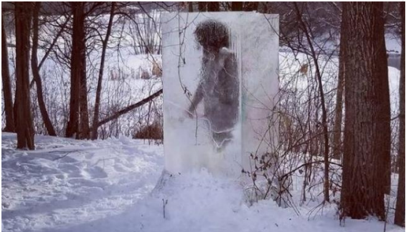
escultura de cavernícola

La Habana, 18 enero- Una peculiar obra de arte que representa un cavernícola dentro un gran bloque de hielo apareció en el Parque Theodore Wirth de la ciudad estadounidense de Minneapolis (Minnesota), atrayendo el interés de muchos residentes locales.