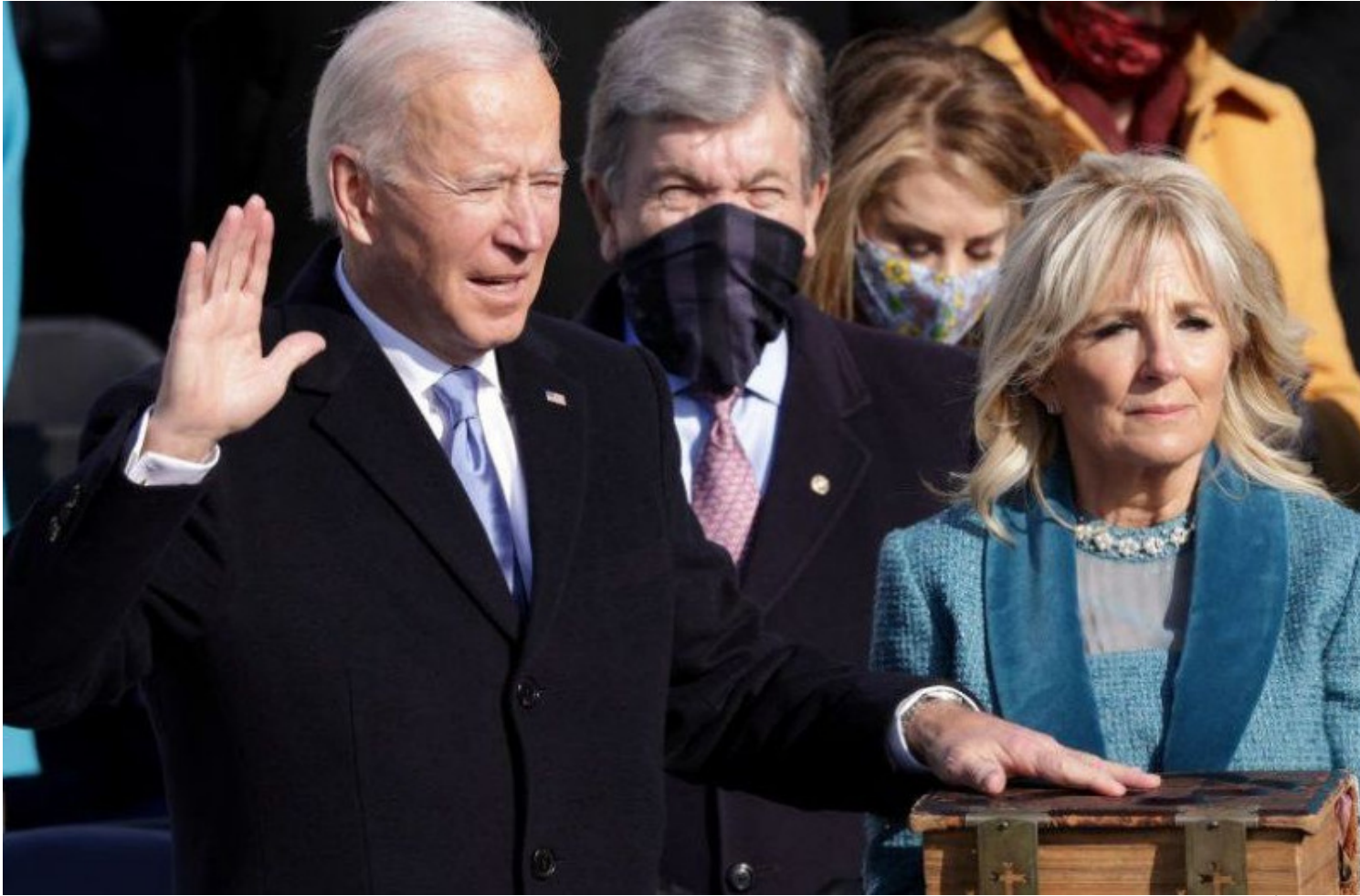
Joe Biden jura el cargo y se convierte en el presidente número 46 de EE.UU.

Washington, 20 ene (AFP) - El demócrata Joe Biden juró este miércoles como el 46 presidente de Estados Unidos, en una ceremonia marcada por la pandemia y la ausencia de su predecesor Donald Trump, que abandonó Washington unas horas antes rumbo a Florida.