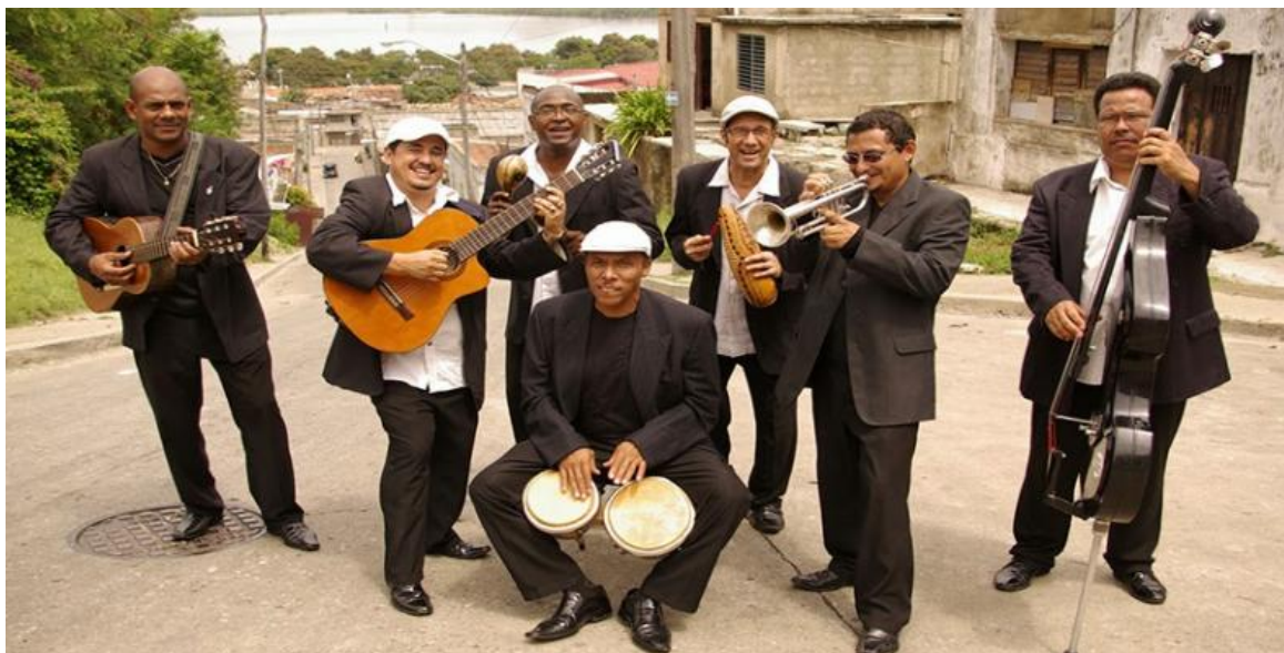
El Septeto Santiaguero celebró su aniversario 26 alejado físicamente de sus seguidores.

Santiago de Cuba, 3 feb (RHC) El Septeto Santiaguero celebró su aniversario 26 alejado físicamente de sus seguidores por el distanciamiento impuesto por la Covid-19, pero siguen pa'lante en la creación y defensa de la buena música cubana.