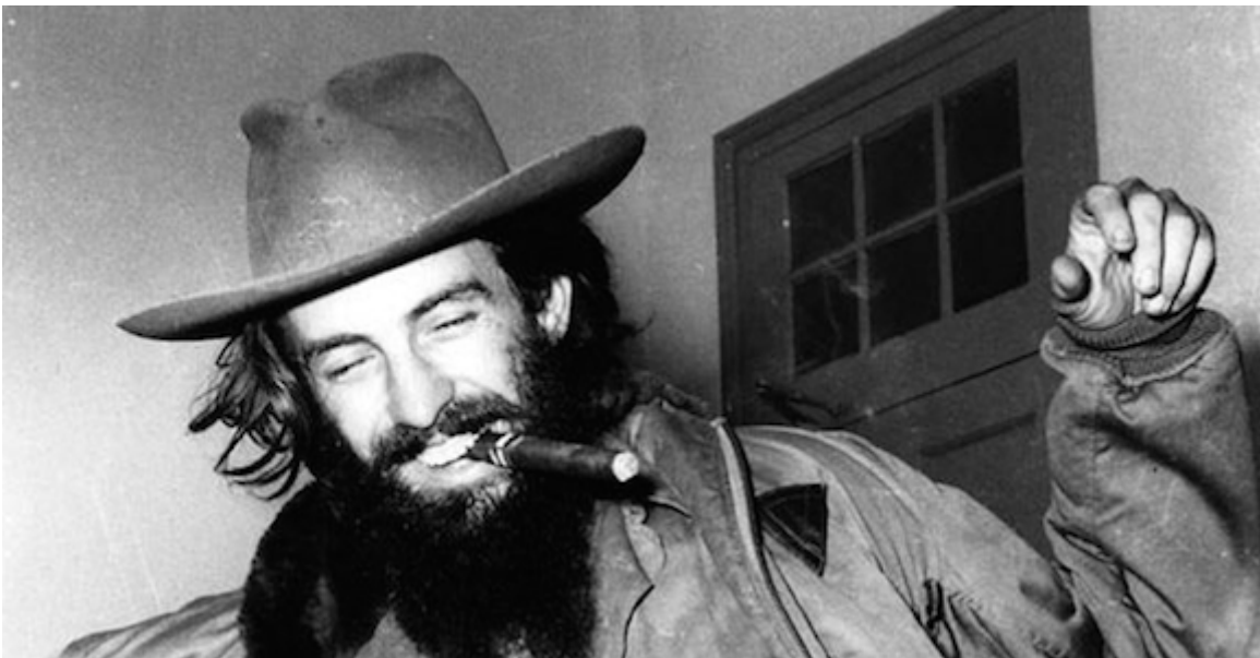
Camilo Cienfuegos.

“A mi modo de ver las cosas, hay un solo camino digno de terminar la situación actual y con sus responsables: seguir la causa de Fidel . Llevar las cosas hasta un punto en que el gobierno se vea obligado a las elecciones generales con verdadera pulcritud. De lo contrario que corra la sangre. Fidel afirmó que este año seremos libres o él morirá. Yo desde hace mucho estoy con él, me lo había jurado y lo cumpliré”.