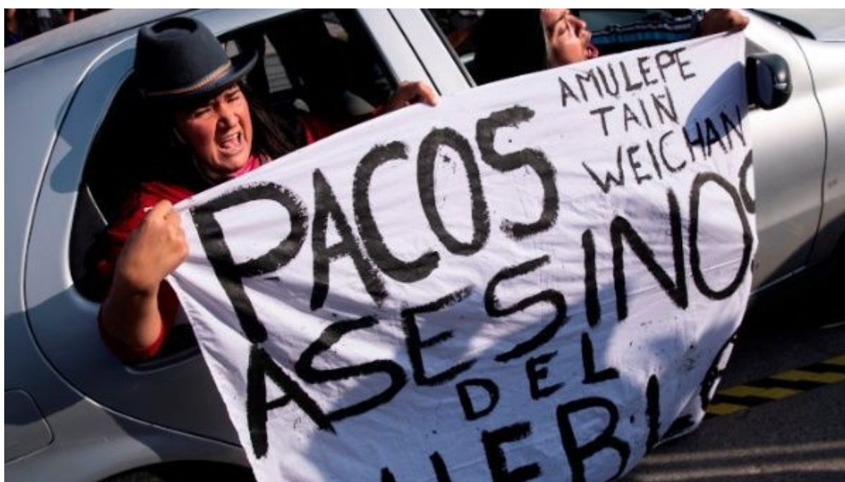
Manifestante acusando de asesino a carabinero,

Santiago de Chile, 9 feb (RHC) Sectores políticos y sociales de Chile demandaron el lunes la desarticulación de Carabineros (policía militarizada) luego del homicidio de un malabarista callejero por un agente de ese cuerpo, que desató una ola de protestas.