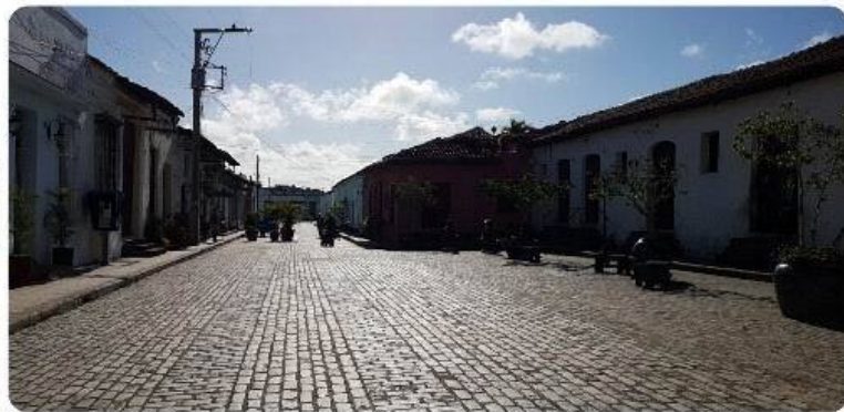
Ciudad de Camaguey.