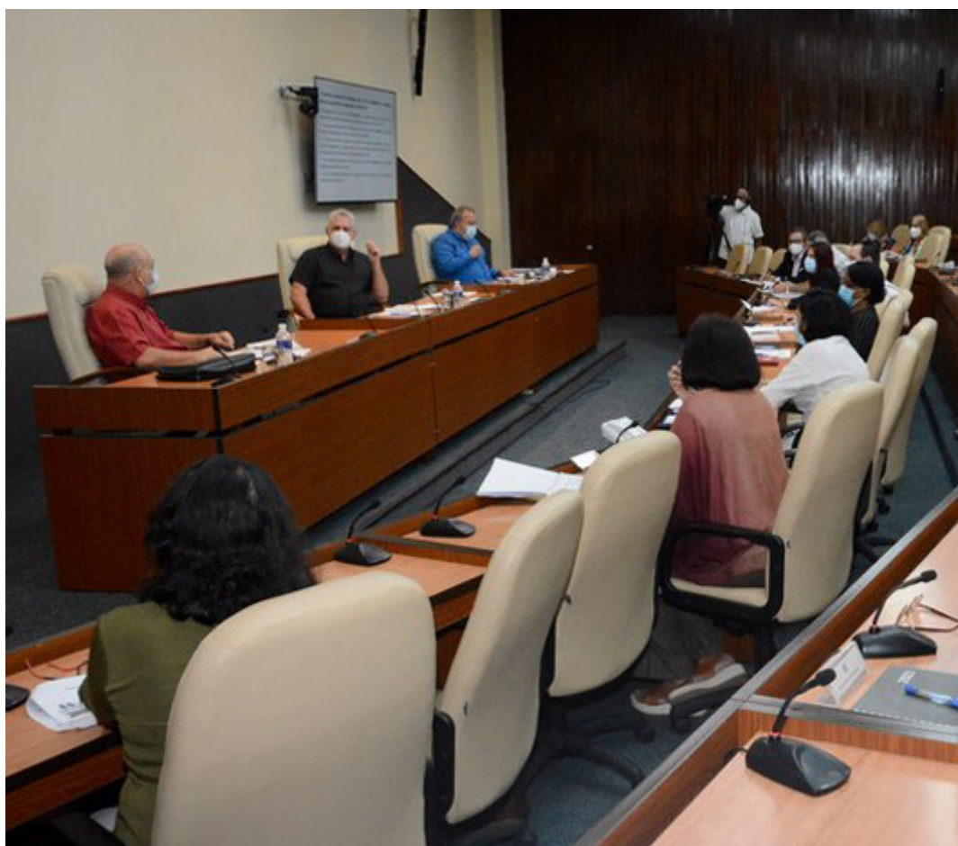
El jefe de Estado (C) reconoció al equipo de los centros que laboran en tan importantes temas.

La Habana, 3 mar (RHC) El presidente de la República, Miguel Díaz-Canel sostuvo un nuevo encuentro con el grupo de expertos y científicos que por casi un año ha participado de forma directa en la batalla de Cuba contra el nuevo coronavirus SARS-Cov-2.