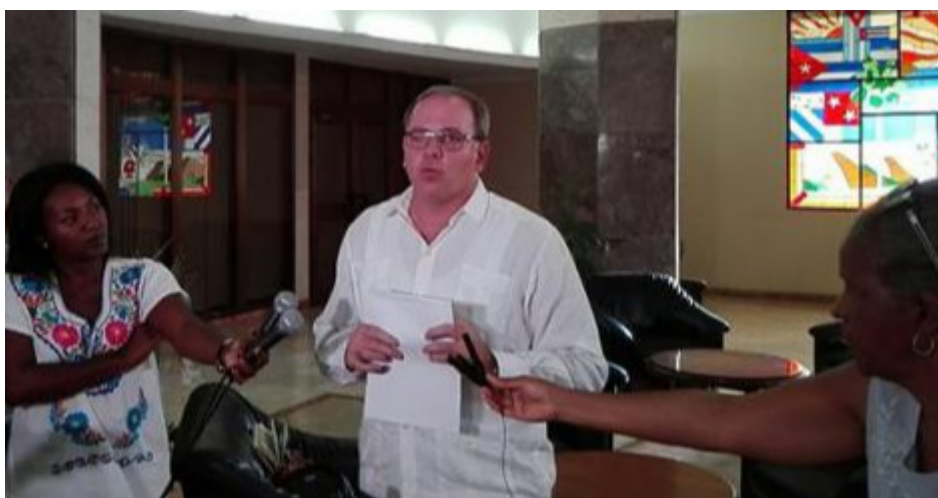
Martínez Enríquez es enfático al referirse a la desfachatez de la legislación.

La Habana, 3 mar (RHC) El director general de América Latina y el Caribe del Ministerio de Relaciones Exteriores de Cuba (MINREX), Eugenio Martínez Enríquez, reiteró la denuncia de la extraterritorialidad de la Ley Helms-Burton, vigente, a 25 años de su publicación.