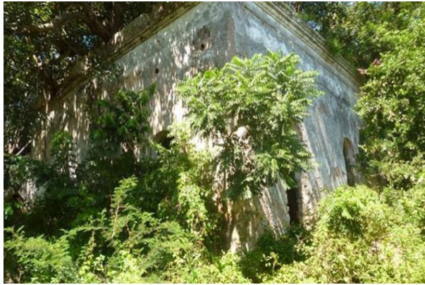
ruinas de la casona Chartrand

Esta mansión sirvió como morada al célebre paisajista del siglo XIX, Esteban Chartrand-Dubois.