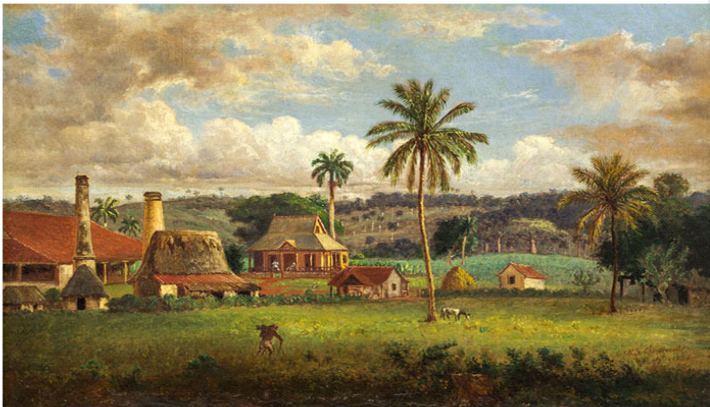
foto del antiguo batey Chartrand

En la provincia Matanzas, justamente en las afueras del poblado Limonar, se encuentra abandonada la casa de vivienda del cafetal Ariadne, edificación con más de un siglo de haber sido construida que los pobladores conocen como las Ruinas de Chartrand.