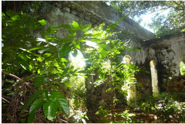
ruinas de la mansión