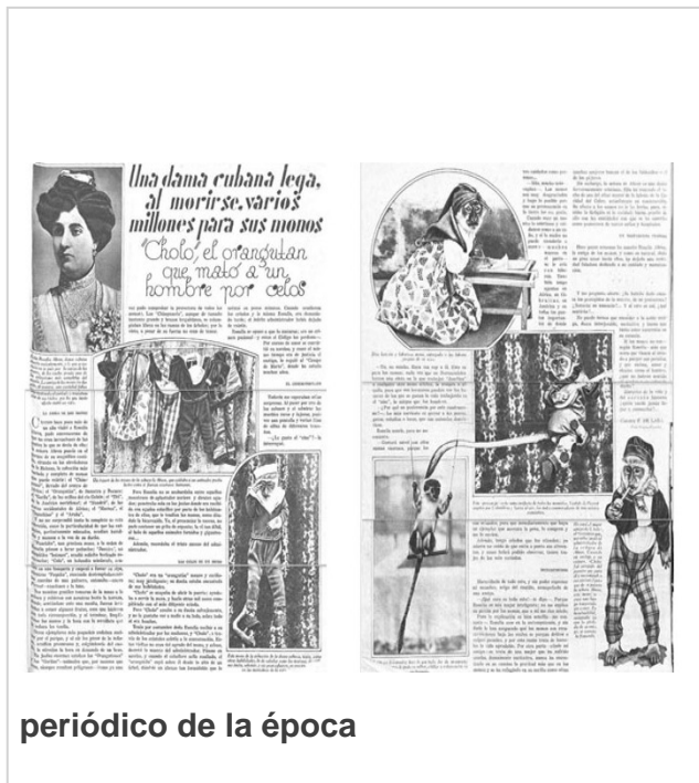
periódico de la época