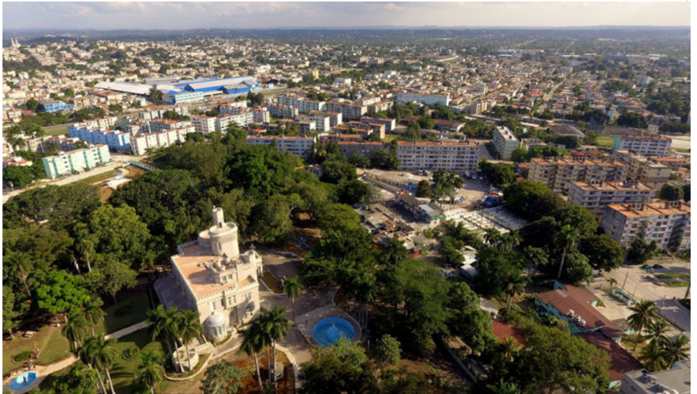
Finca de Rosalía Abreu