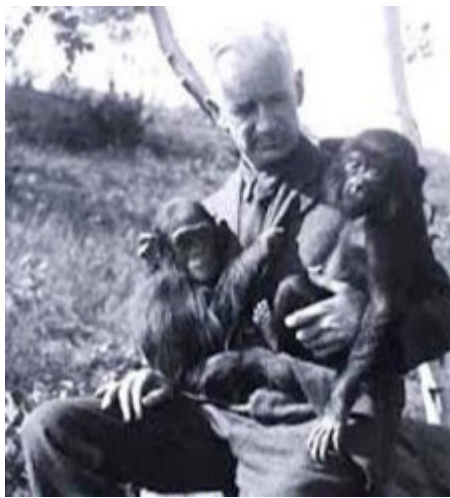
Doctor Robert M. Yerkes