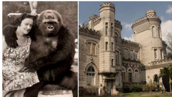
Rosalía y un orangután

En diferentes etapas, el palacete de Rosalía Abreu ha sido sede de instituciones educativas, culturales o deportivas, entre las que figura un Palacio de Pioneros. Mas, no hay que engañarse, según aseguran algunos, en las noches de luna llena se pueden percibir aún las sombras de unos monos bailando un