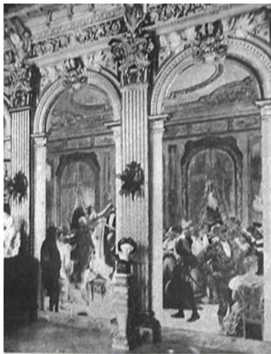
mural de Menocal

Con el tiempo, la aristócrata, que entrega fuertes sumas de dinero a la causa independentista durante la Tregua Fecunda y atesora una pintura mural sobre la batalla de Coliseo, perteneciente a Armando Menocal, percibe en algunos chimpancés rasgos de inteligencia que, de inmediato, se propone desarrollar. Gracias a su paciencia y bondad, logra que estos realicen algunas labores domésticas, como lavar y planchar ciertas piezas, y los acostumbra a no andar en cueros, tomar agua en vasos y comer con cubiertos en la mesa. Otros simios, más audaces, aprenden a «tocar» el piano o la guitarra, montan bicicletas y hasta fuman con pipas. Eso sí, la disciplina es férrea: a los sediciosos los castiga y a los más aplicados y obedientes los premia llevándolos a las habitaciones del recinto, donde encuentran juguetes propios para ellos, hamacas y camas con colchones de plumas.