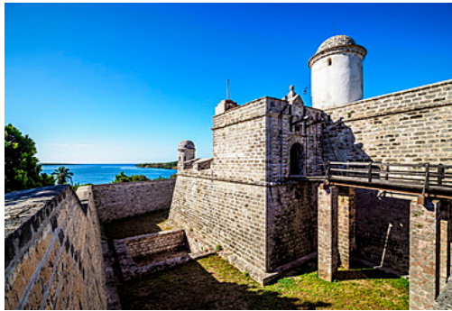
Foso Castillo de Jagua

Posee un foso que nunca fue inundado con puente levadizo de madera en perfectas condiciones, siendo uno de los últimos que se mantienen aptos para su uso, desde donde se puede acceder al interior del recinto amurallado, a las celdas, la capilla, las explanadas, desde donde aún una batería de cañones apunta a las aguas del mar Caribe.