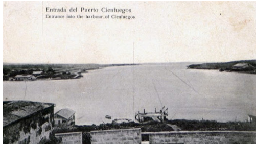
entrada puerto Cienfuegos

Desde el siglo XVI, se pensó en la necesidad de fortificar la bahía de Jagua, nombre aborigen, actual Cienfuegos, dado lo propicio del lugar para la estancia y aprovisionamiento de corsarios y piratas, así como las facilidades que la soledad del paraje proporcionaba al comercio de contrabando.