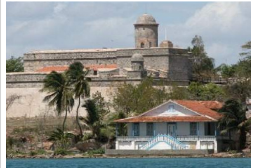
Fortaleza Castillo de Jagua

La puerta de entrada tiene forma rectangular coronada por un arco abovedado. Una escalera de caracol enlaza los dos niveles de la Fortaleza. La torre es cilíndrica con su cubierta en forma de cúpula define la mayor altura del inmueble. En los extremos de la plaza de armas, están situadas dos garitas cilíndricas con sus aspilleras dirigidas hacia la bahía.