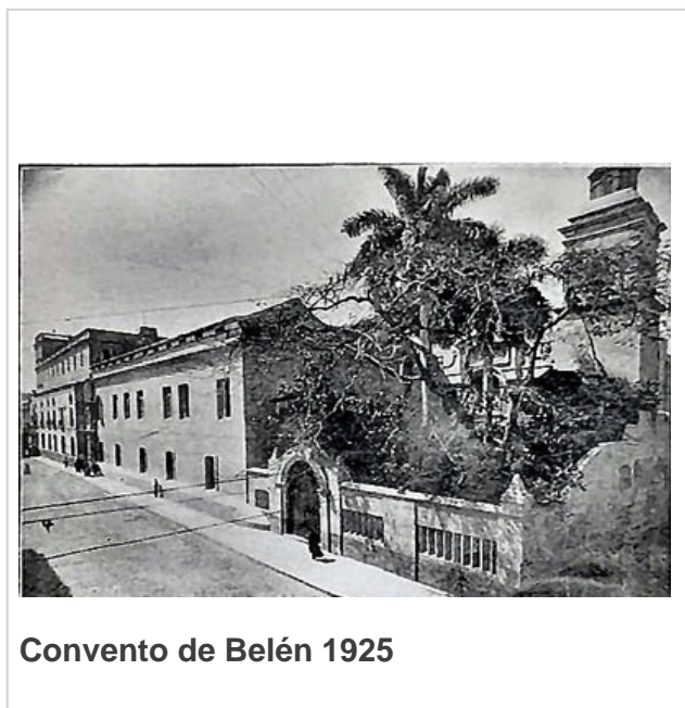
Convento de Belén 1925

En las primeras décadas del pasado siglo XX se remodeló para crear mejores condiciones en el colegio. En 1925 los jesuitas se trasladaron a otra instalación en el barrio de Marianao.