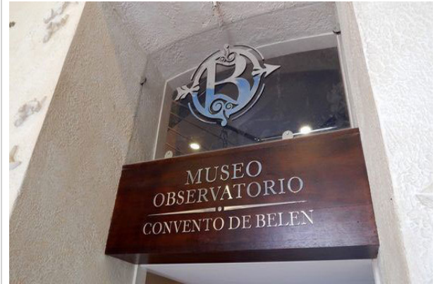
Museo observatorio Covento de Belén

Gracias a proyectos de cooperación en 1996 se inauguró la Iglesia restaurada. Paulatinamente se fue trabajando en la recuperación de todo el conjunto religioso se devolvió el esplendor de los espacios dedicados a las ciencias, como la torre noroeste del edificio, donde se halla hoy el primer Museo Meteorológico de Cuba.