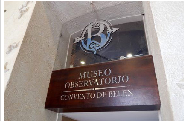
Museo observatorio Covento de Belén

Gracias a proyectos de cooperación en 1996 se inauguró la Iglesia restaurada. Paulatinamente se fue trabajando en la recuperación de todo el conjunto religioso se devolvió el esplendor de los espacios dedicados a las ciencias, como la torre noroeste del edificio, donde se halla hoy el primer Museo Meteorológico de Cuba.