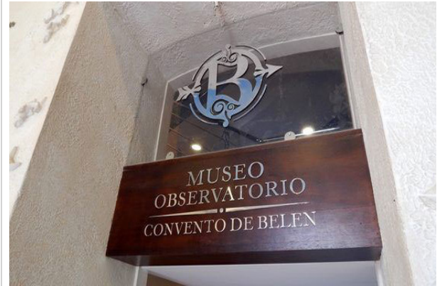
Museo observatorio Covento de Belén

Gracias a proyectos de cooperación en 1996 se inauguró la Iglesia restaurada. Paulatinamente se fue trabajando en la recuperación de todo el conjunto religioso se devolvió el esplendor de los espacios dedicados a las ciencias, como la torre noroeste del edificio, donde se halla hoy el primer Museo Meteorológico de Cuba.