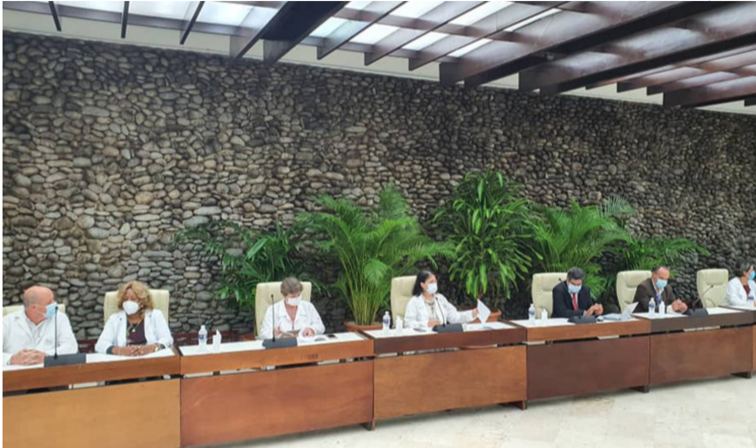
Conferencia de prensa en La Habana.

La Habana, 19 mar (RHC) Expertos del grupo empresarial de la industria biofarmacéutica, BioCubaFarma aseguran que las capacidades de producción en nuestro país de las formulaciones de Soberana 02 y Abdala permitirán contar, en el mes de agosto, con las dosis suficientes para inmunizar a toda la población cubana.