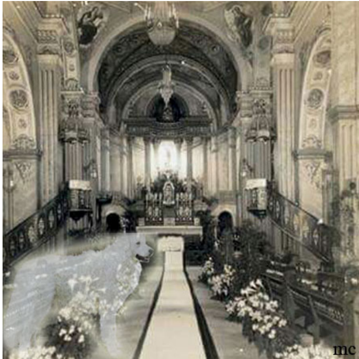
Fantasma del perro en la iglesia de Matanzas.