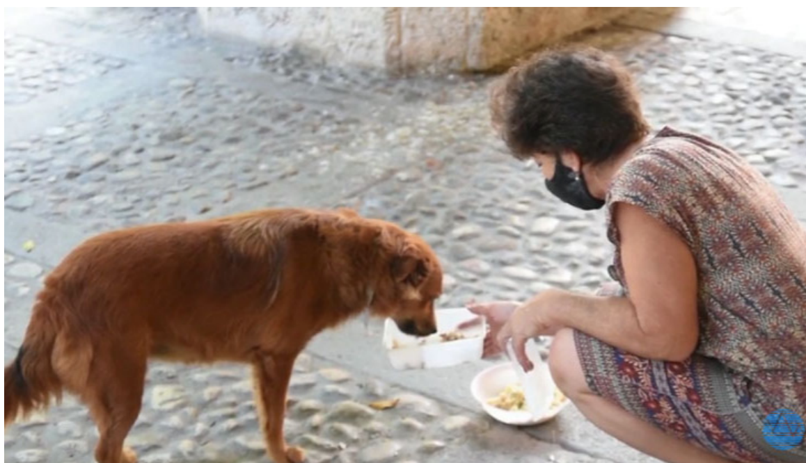
Política de Bienestar Animal.

La Habana, 31 mar (RHC) Un grupo temporal de trabajo recientemente habilitado implementará la política de Bienestar Animal mediante el chequeo del completamiento del sistema de clínicas, consultorios y farmacias veterinarias en el país, así como el programa de producción de medicamentos, incluyendo los de origen natural, y la recapitalización, de conjunto con el Ministerio de Salud Pública, de los centros de observación de los animales.