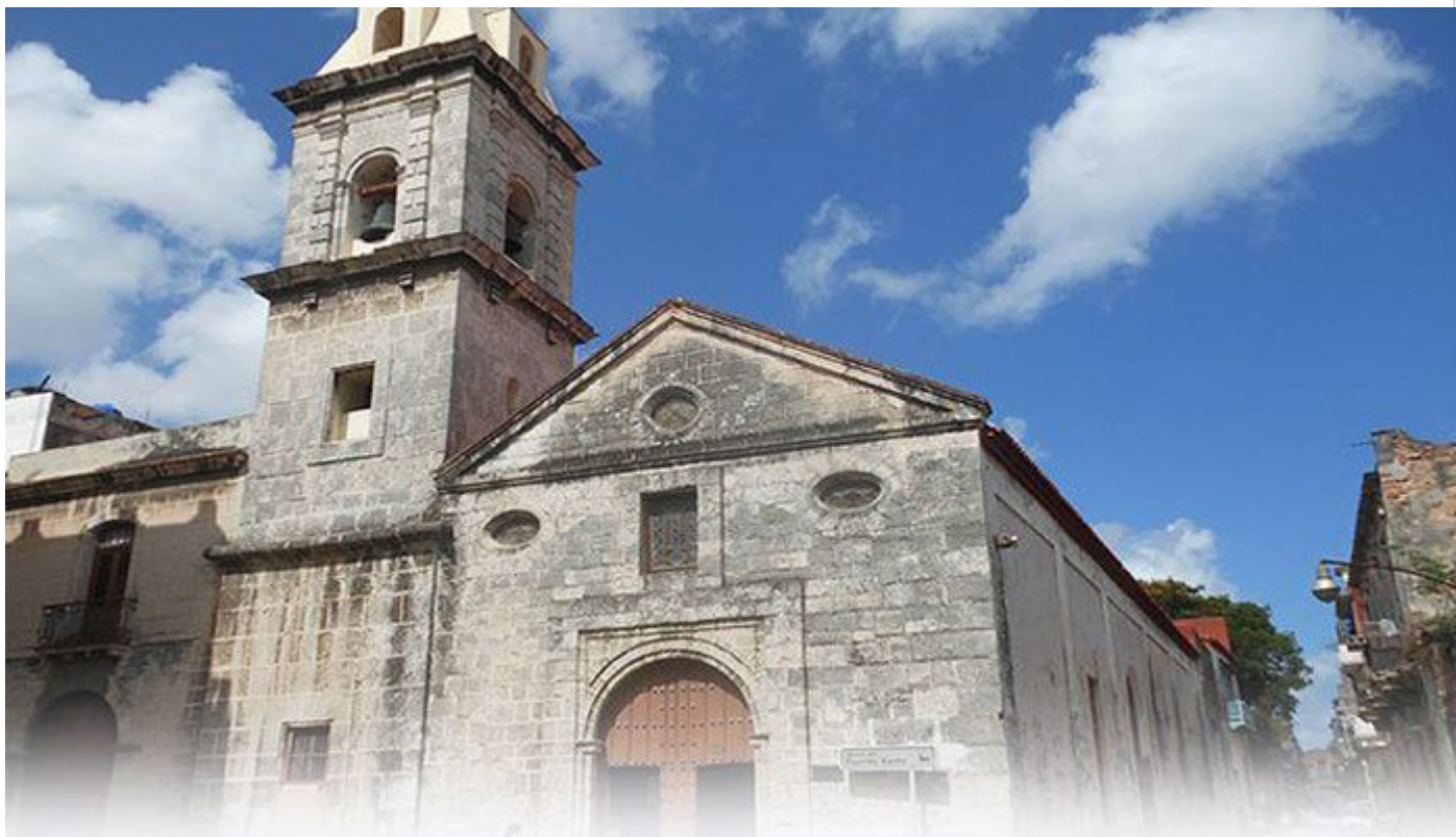
Iglesia del Espíritu Santo

En la Habana del siglo XVI se iban construyendo casas, primero de madera y guano, después de mampostería o piedras de canto y techos de madera sobre los que reposaban tejas criollas hechas de barro cocido que al principio venían de España y luego se empezaron a confeccionar en los tejares de la Isla.