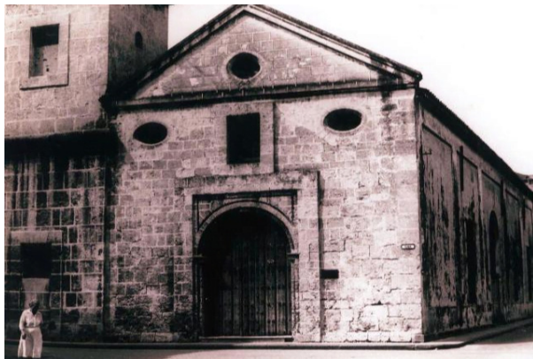
iglesia del Espíritu Santo

Esta iglesia es considerada la más antigua que hoy tiene La Habana. Está situada en el corazón de La Habana colonial, en la esquina que forman las calles Cuba y Acosta. Según documentos de Archivo, en 1638 se construyó la ermita, entonces pequeña y pobre, dedicada por los negros libres a un santo de su devoción. Años después las autoridades eclesiásticas decidieron convertirla en la segunda iglesia parroquial de la capital.