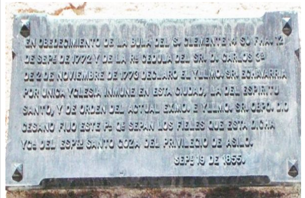
tarja iglesia del Espíritu Santo

Interior puerta de entrada de la iglesia