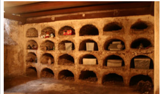
criptas funerarias de la iglesia del Espíritu Santo

La Iglesia del Santo Ángel Custodio es otra de las obras de Diego Evelino de Compostela, fue creada en 1690 en ella fueron bautizados Félix Varela y José Martí . El nuncio la declaró auxiliar de la Parroquial Mayor de La Habana en 1693, elevándola a la condición de parroquia en 1703. (Recopilación de Internet)