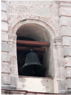
campanario de la iglesia del Espíritu Santo

La campana más grande y antigua, con un sonido más grave y hermoso, está dedicada a San José y data del año 1688, en los tres primeros años del gobierno episcopal de la Isla del obispo Diego Evelino Hurtado y Vélez (Compostela). Cuentan que en su fundición se añadieron al bronce muchas onzas de oro.