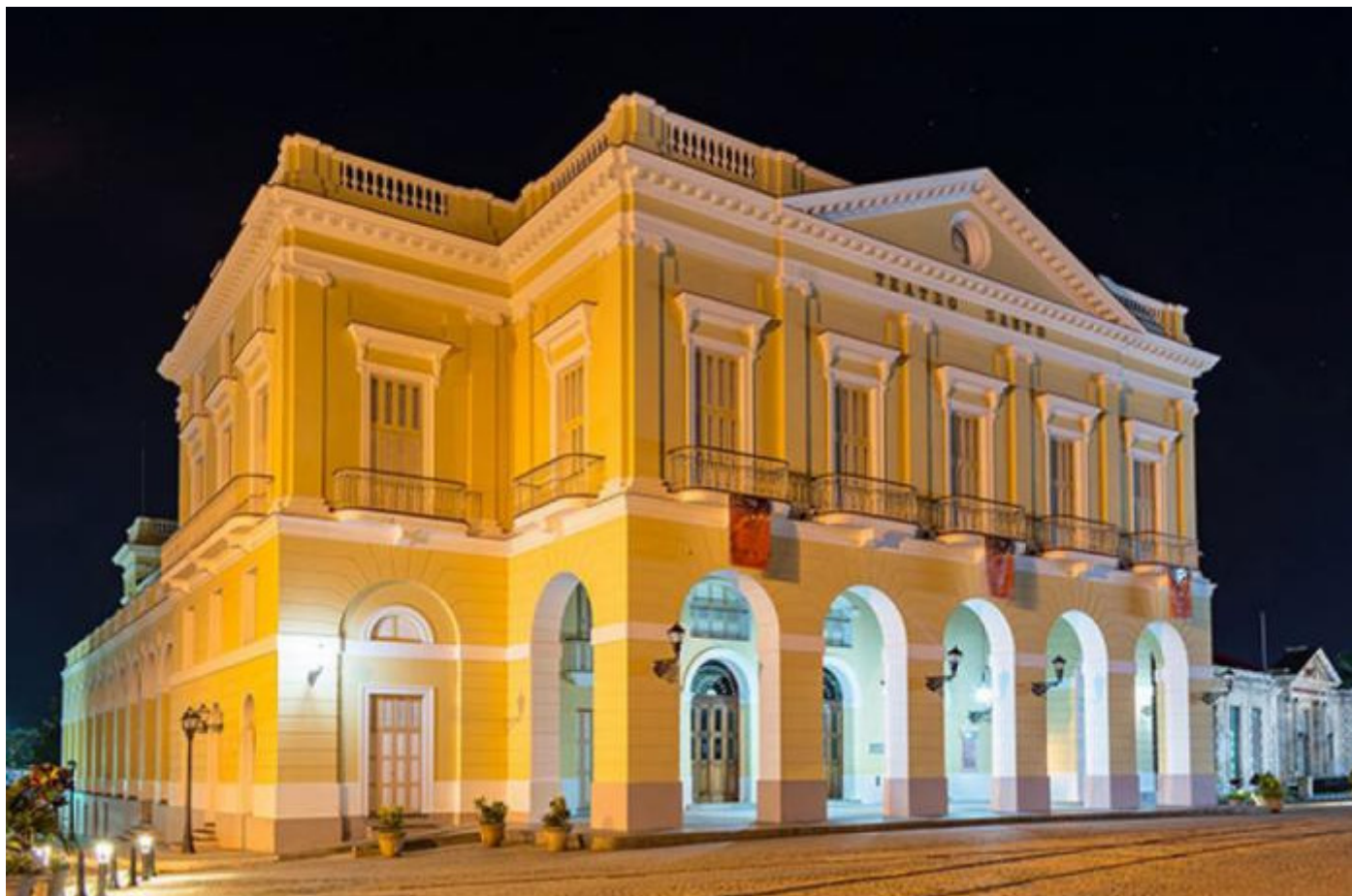
El majestuoso teatro Sauto.