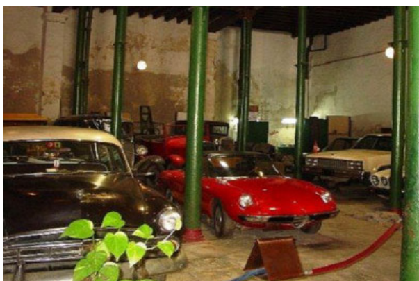
Alfa Romeo museo

Reinaugurado en su totalidad como parte de las actividades por el aniversario 501 de la fundación de la villa de San Cristóbal de La Habana se pueden apreciar entre otros clásicos de gran valor patrimonial, autos como el Maserati similar al del legendario Juan Manuel Fangio que utilizaría para el Grand Prix de La Habana en 1957.