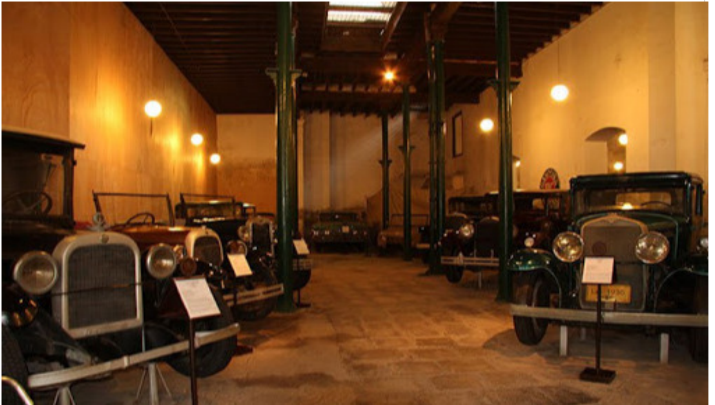
Museo del Automóvil en La Habana

El Museo del Automóvil de La Habana, “El Garaje”, está situado en la calle San Ignacio, entre Amargura y Teniente Rey, en el Centro Histórico de la ciudad, donde se exponen los automóviles más relevantes de la primera mitad del siglo XX en Cuba.