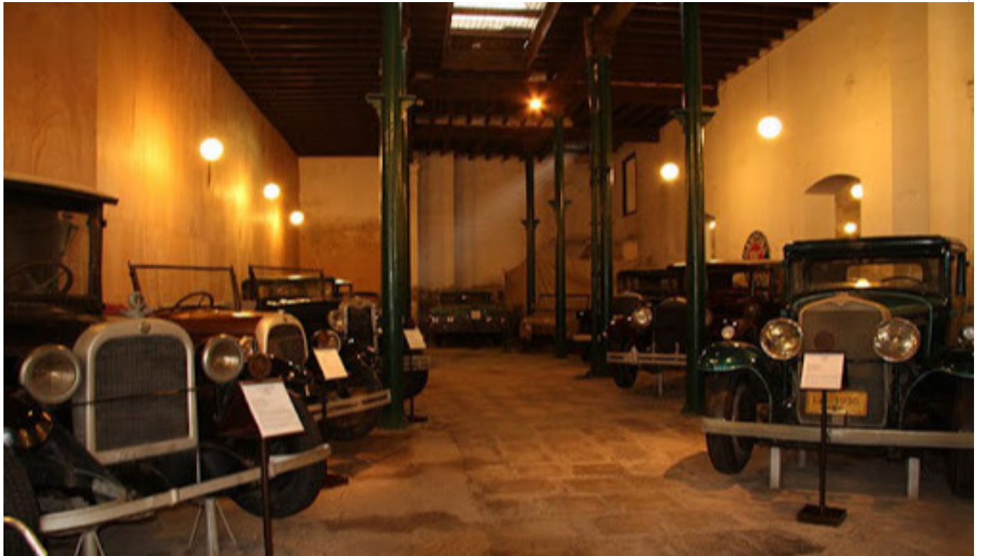
Museo del Automóvil en La Habana

El Museo del Automóvil de La Habana, “El Garaje”, está situado en la calle San Ignacio, entre Amargura y Teniente Rey, en el Centro Histórico de la ciudad, donde se exponen los automóviles más relevantes de la primera mitad del siglo XX en Cuba.