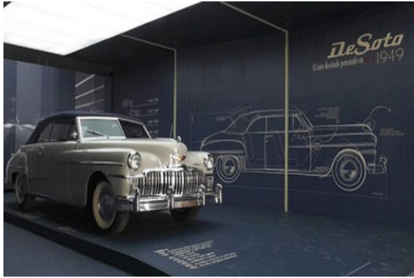
auto De Soto

Si antes se podía apreciar el auto De Soto de 1949, donado al historiador de la ciudad, Eusebio Leal Spengler, por las autoridades de Chicago, Estados Unidos, ahora el público puede conocer la historia del automovilismo en la Isla.