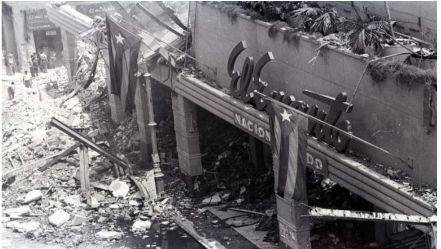
Sabotaje a la tienda El Encanto

por: Dinella García Acosta, Rogelio Carmentate