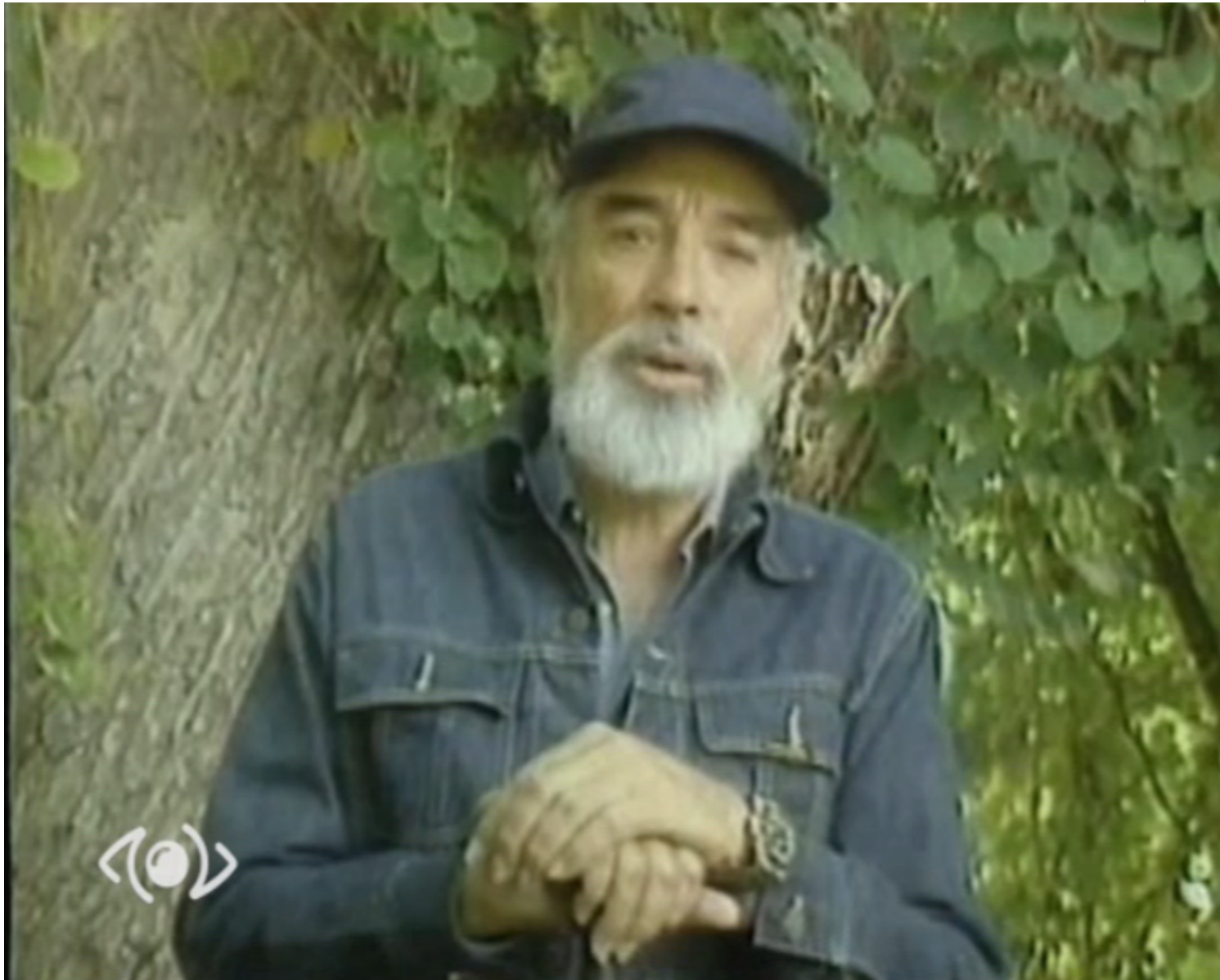
El capitán Núñez Jiménez en plena acción

París, 16 abr (RHC) El Consejo Ejecutivo de la Unesco recomendó al ente multilateral su asociación con las celebraciones en Cuba por el centenario del natalicio del científico y revolucionario Antonio Núñez Jiménez y la artista plástica Martha Arjona.