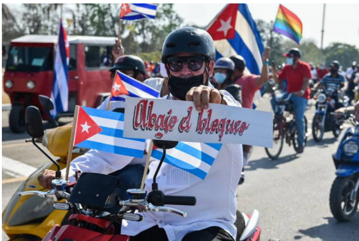
Caravana contra el bloqueo en Villa Clara

En algún momento de la conversación telefónica Franco Cavalli se muestra indignado. Incluso muy indignado. El antiguo parlamentario del Partido Socialista Suizo en el cantón de Tesino, y jefe de fracción, dice: «Es una vileza. No, es más que eso. Es una infame vileza».