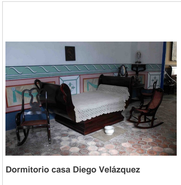
Dormitorio casa Diego Velázquez

Según varias investigaciones, el mobiliario se importaba desde el siglo XVI hasta finales del XVII, en este último comenzó a construirse por los artesanos de la Isla y, posteriormente, se copiaron estilos europeos.