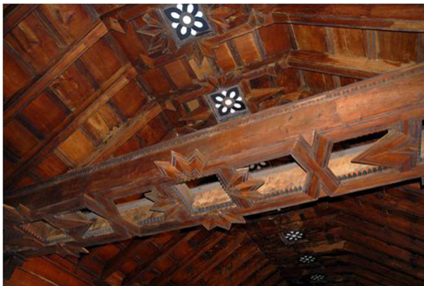
Casa de Diego Velázquez, la más antigua de Cuba

En la década de los 40 del pasado siglo, el prestigioso arqueólogo, restaurador de obras arquitectónicas y especialista en Artes, de origen catalán, Francisco Prat Puig, asumió el rescate de la deteriorada mansión para evitar que fuera vendida para su demolición.