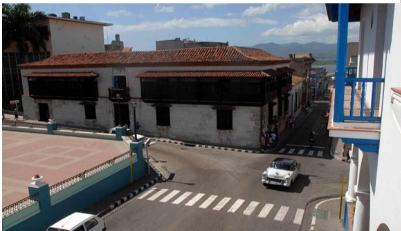
Casa de Diego Velázquez la más antigua de Cuba

Considerada la casa más antigua de Cuba y una de las de América, donde vivió y murió Diego Velázquez, conquistador español, primer Gobernador de Cuba y fundador de las siete primeras villas en el país, está ubicada al oeste del parque Carlos Manuel de Céspedes, (Plaza de Armas durante la colonia), entre las calles Aguilera y Santo Tomás, en la ciudad de Santiago de Cuba.