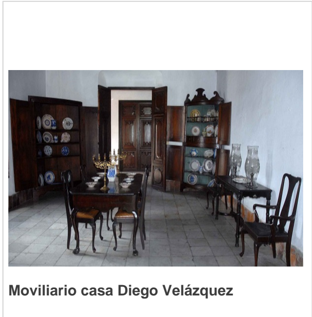
Moviliario casa Diego Velázquez

En cuanto a la del siglo XIX, refleja la