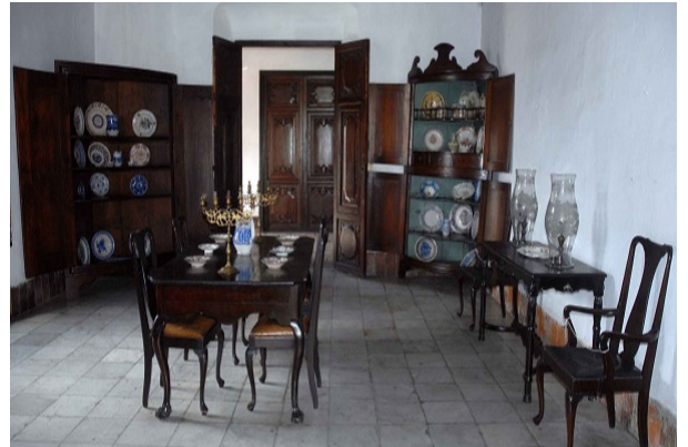
Moviliario casa Diego Velázquez

En cuanto a la del siglo XIX, refleja la