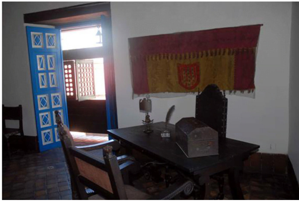
Buró casa Diego Velázquez

El inmueble se levantó entre 1516 y 1530 donde funcionó la Casa de Gobernación y de vivienda de Diego Velázquez, y en la planta baja la Casa de Contratación y de fundición de oro de la Corona española.