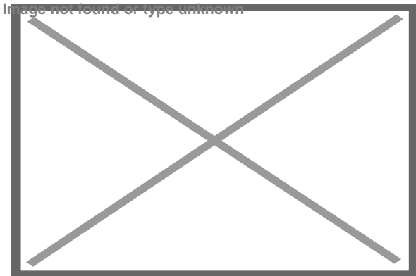
Casa de Diego Velázquez, la más antigua de Cuba

En la década de los 40 del pasado siglo, el prestigioso arqueólogo, restaurador de obras arquitectónicas y especialista en Artes, de origen catalán, Francisco Prat Puig, asumió el rescate de la deteriorada mansión para evitar que fuera vendida para su demolición.