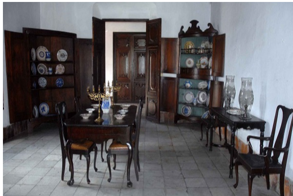
Moviliario casa Diego Velázquez

En cuanto a la del siglo XIX, refleja la