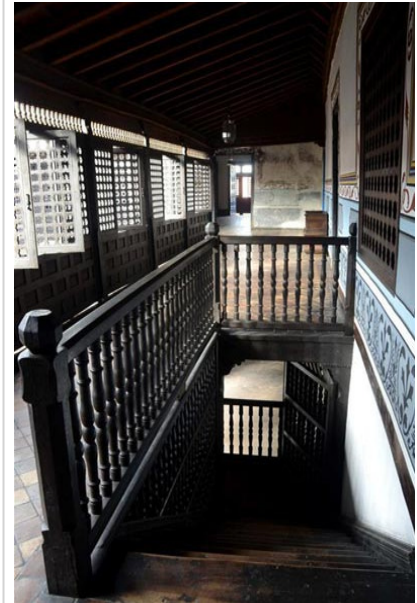
Escaleras casa Diiego Velázquez

algunos horcones de madera sujetos con pasadores de plomo y techos de armadura.