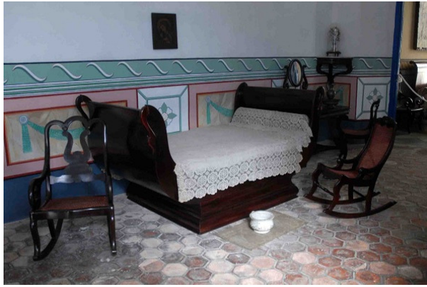
Dormitorio casa Diego Velázquez

Según varias investigaciones, el mobiliario se importaba desde el siglo XVI hasta finales del XVII, en este último comenzó a construirse por los artesanos de la Isla y, posteriormente, se copiaron estilos europeos.