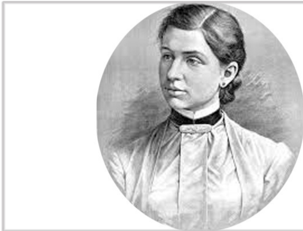
Laura Martínez de Carvajal primera mujer graduada de médico en Cuba

Laura Martínez de Carvajal, nació el 27 de agosto de 1869, siendo la primera hija de una familia española adinerada, que tenía acceso a los círculos más selectos de la sociedad cubana. Desde pequeña demostró ser una niña precoz al saber leer a los cuatro años.