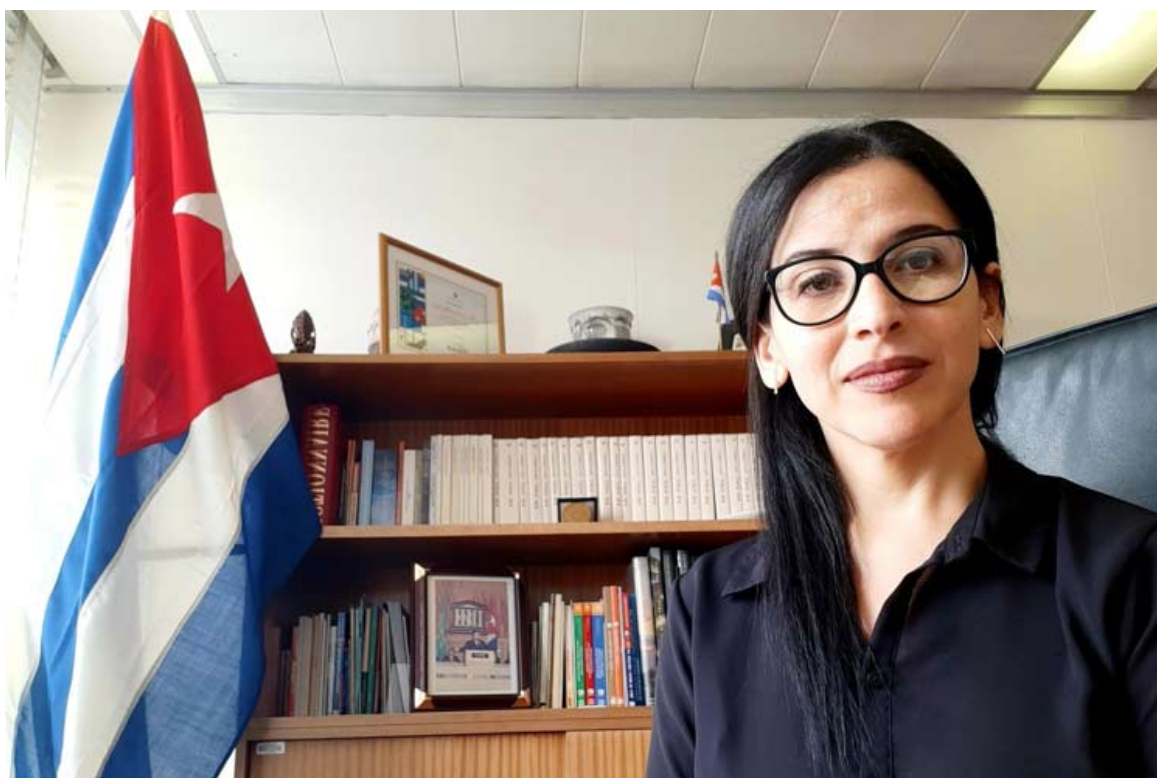
Cuba's PR to UNESCO, Yahima Esquivel.

Nueva York, 12 may (RHC) La representante permanente de Cuba ante la Organización de las Naciones Unidas para la Educación, las Ciencias y la Cultura (Unesco), Yahima Esquivel, destacó el reconocimiento de ese organismo internacional a los avances de la nación caribeña en temas de igualdad de género e inclusión.