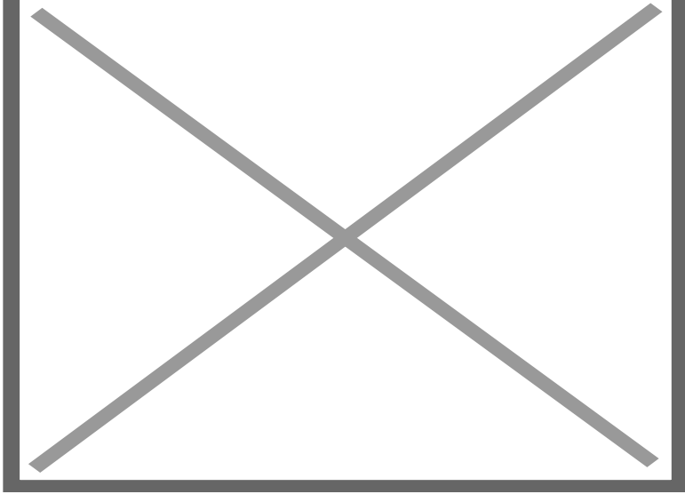
Teatro Coliseo en la Alameda de Paula

La villa colonial de San Cristóbal de La Habana, en su condición de ciudad portuaria, acogía y bendecía (desde la iglesia del Santo Cristo del Buen Viaje) a visitantes en tránsito entre ellos, a músicos, comediantes y empresarios itinerantes, en busca de la mejor plaza para su arte.