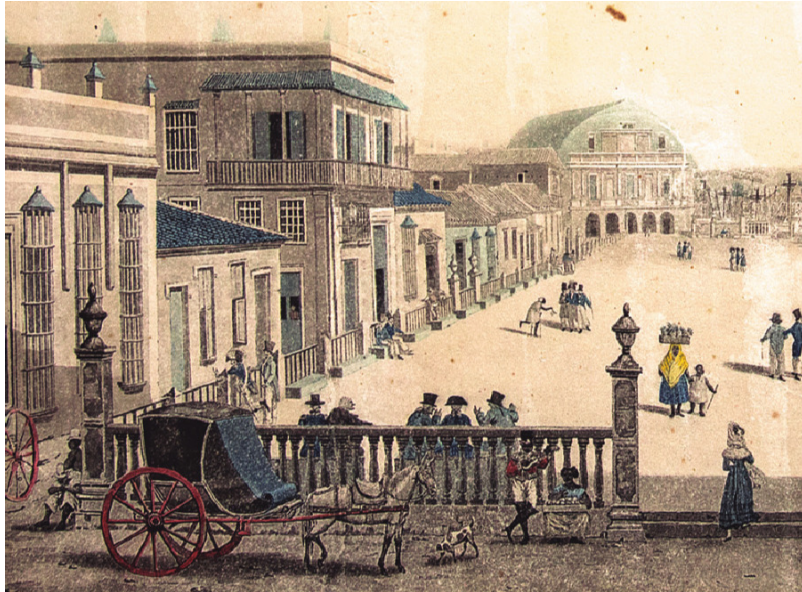
Teatro Coliseo en la Alameda de Paula

El Coliseo de La Habana, o Teatro Principal estaba ubicado frente a la Alameda de Paula , inaugurada por esas fechas, y entre las calles Acosta, Oficios y Luz (donde hoy en día confluyen las calles de Oficios y Luz en La Habana Vieja), abrió sus puertas el 20 de enero de 1775.