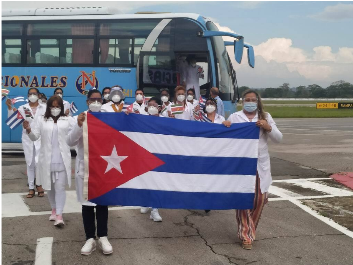
Brigada médica en Surinam, orgullo cubano.

La Habana, 31 may (RHC) Colaboradores de la brigada médica cubana Henry Reeve en Surinam arribaron este domingo a Cuba, tras combatir por 14 meses la pandemia de la Covid-19 en esa nación.