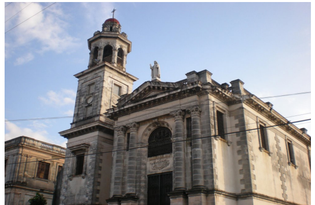
Nuevo Convento de Santa Clara en Lawton

Luego de esta última fecha se sucedieron como ocupantes: el Ministerio de Bienestar Social (hasta 1961), los Talleres y Almacenes Nacionales de Servicios de Teatros (TANST), así como otras dependencias del Consejo Nacional de Cultura (más tarde Ministerio de