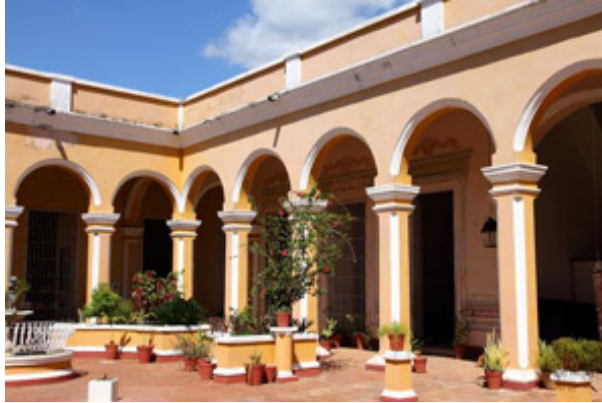
Patio Convento Santa Clara

Llegó a contar en el siglo XVIII con tres claustros, Iglesia con dormitorio, refectorio, cocina, enfermería, huerto, iglesia y, en general, las instalaciones necesarias para la vida de una comunidad femenina de unas cien religiosas y otras tantas esclavas o servidoras.