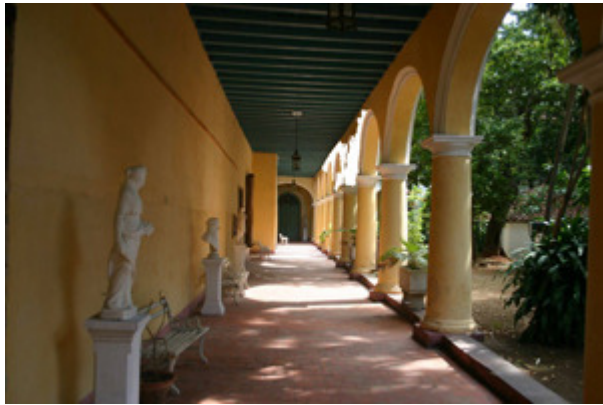
Pasillos del Convento

Una vez finalizado el conflicto armado, regresaron a su vida de clausura y mantuvieron la sede de su congregación en este edificio hasta 1921, año en que lo venden a una entidad inmobiliaria para trasladarse al barrio habanero de Lawton, en el municipio capitalino de Diez de Octubre.