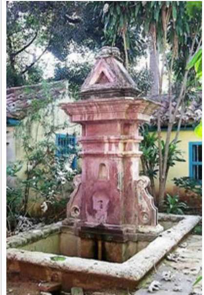
Fuente Samaritana del Convento de Santa Clara

Revestidos por tejas criollas de barro, los techos conforman un imponente juego de niveles y texturas cuando se les puede observar desde lo alto. Interiormente son de maderas preciosas, planos en las plantas bajas y de aguas en las altas. Algunos como el de la nave de la iglesia, alcanzan proporciones considerables.