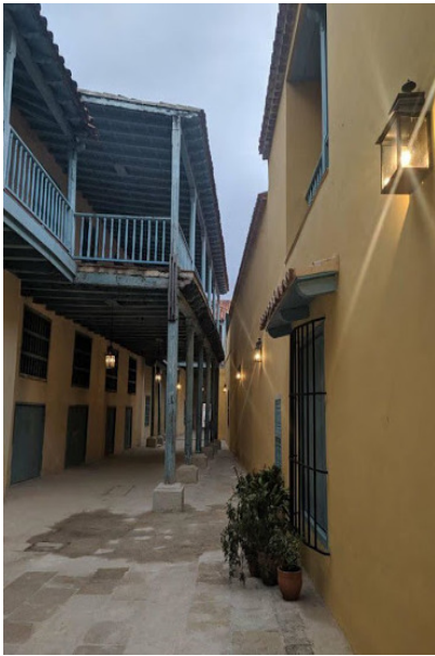
Interior del Convento de Santa Clara

La casa de dos plantas que aquí se encuentra, según cuenta la leyenda, la dio un marino como dote para que su hija ingresara en el convento. Otra historia relata que, habiendo muerto el marino, su viuda y su hija profesaron y se quedaron viviendo en la casa que finalmente fue circundada por los muros del convento y diferentes fuentes afirman que dicha construcción parece corresponder a las celdas alta y baja que, de acuerdo al contrato conservado en el Archivo Nacional, el escribano Nicolás de Guilizastli hizo construir en el patio para sus dos hijas.