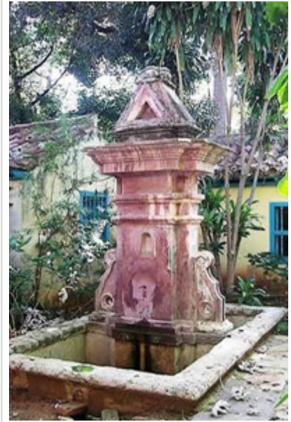
Fuente Samaritana del Convento de Santa Clara

Revestidos por tejas criollas de barro, los techos conforman un imponente juego de niveles y texturas cuando se les puede observar desde lo alto. Interiormente son de maderas preciosas, planos en las plantas bajas y de aguas en las altas. Algunos como el de la nave de la iglesia, alcanzan proporciones considerables.