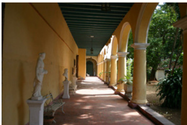
Pasillos del Convento

Habana había comenzado a modernizarse, tranvías eléctricos se desplazaban por toda la ciudad y las monjas clarisas sienten las molestias del ruido exterior y frecuentemente se les interrumpe en sus oraciones y demás oficios religiosos.