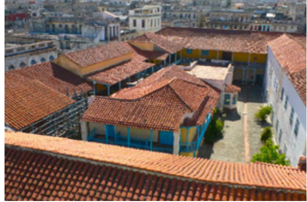
Techos de los distintos claustros del Convento

Habana había comenzado a modernizarse, tranvías eléctricos se desplazaban por toda la ciudad y las monjas clarisas sienten las molestias del ruido exterior y frecuentemente se les interrumpe en sus oraciones y demás oficios religiosos.