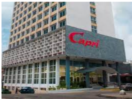
Hotel Capri/La Habana