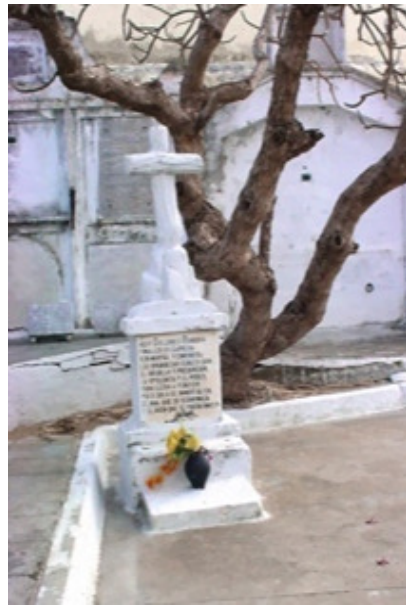
Tumba de Dolores Rondón

Rápidamente el texto era conocido por todos y aunque la fosa desapareció ya muchos pobladores tenían la transcripción o se lo sabían de memoria.