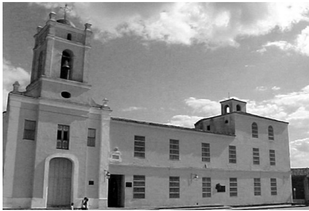
Hospital San Juan de Dios