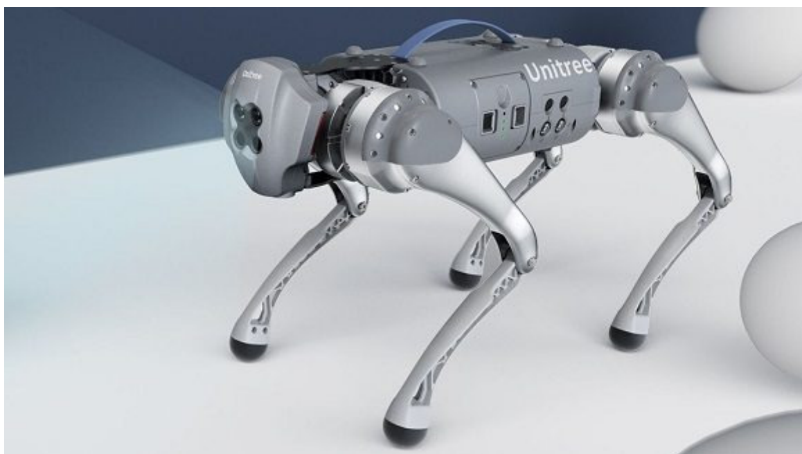
Go 1 es la nueva marca de perros robots acompañantes.

La empresa china Unitree Robotics anunció el martes último el lanzamiento al mercado una serie de perros robot 'acompañantes' denominada Go 1 tras años de elaboración. Un video en el que se muestran sus habilidades ha sido publicado en la cuenta oficial de la compañía en YouTube.