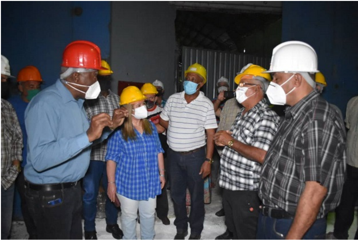
El vicepresidente de Cuba realiza visita de trabajo a la central provincia de Villa Clara.

Villa Clara, 12 jun (RHC) El miembro del Buró Político del Partido Comunista de Cuba (PCC), Salvador Valdés Mesa, visitó la provincia de Villa Clara donde llamó a ser más exigentes en el enfrentamiento a los precios abusivos, la reventa, los coleros y especuladores.