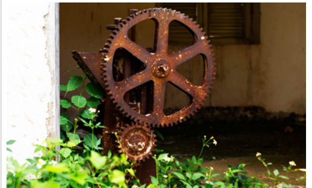
Viejo Molino de la Quinta de los Molinos

El herbario del antiguo Jardín Botánico de la Habana, fue el núcleo del cual se partió, para buscar el desarrollo acelerado de la colecta botánica en el país, fue inscrito en 1906 como sitio de referencia importante en el Sistema Mundial de Jardines Botánicos. En ese lugar fue declarada en el año 1936, la mariposa, como flor nacional de Cuba.