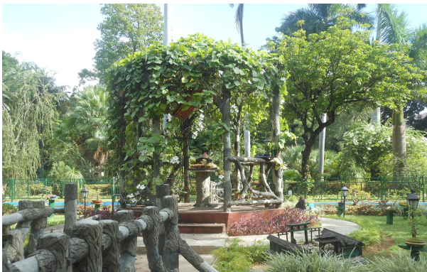
Isla de los Bonsai

Se destacan las famosas ceibas y varias especies de palmas en el Palmetum, especialmente las cubanas como la Palma real ( Roystonea regia ), la Palma corcho ( Microcycas Calocom ), la Palma Hemithrinax ekmaniana .