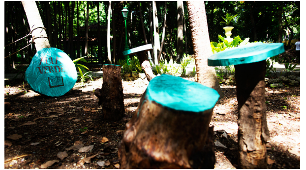
Aula Verde en la Quinta de los Molinos

educativos, protege gran cantidad de distintas variedades de estos insectos, permite su reproducción, muestra el proceso de metamorfosis, demuestra el papel ecológico que desempeñan en la naturaleza y la necesidad de su protección y conservación.