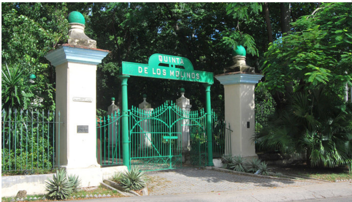
Entrada a la Quinta de los Molinos

La Quinta de los Molinos es una institución Monumento Nacional ubicada en un lugar céntrico de la Habana, con una amplia y complicada historia que la relaciona, desde la época de la colonia, con varios acontecimientos y personajes, principalmente con el Generalísimo Máximo Gómez.