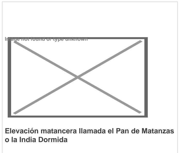
Elevación matancera llamada el Pan de Matanzas o la India Dormida

El llano en el que la india reposaba se transformó en montaña, en una elevación que conserva la figura de una mujer dormida, y que más tarde fue nombrada el Pan de Matanzas. La mujer de fuego se transformó así en mujer de piedra, y junto a la bahía constituye uno de los más singulares y conocidos