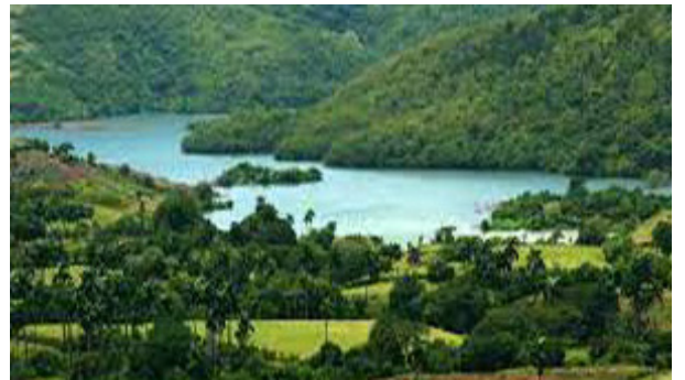
Río de Yumurí