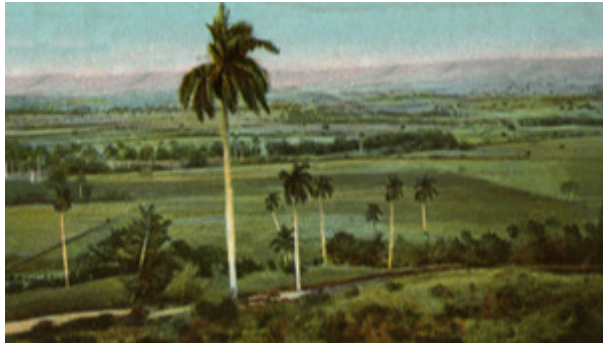
Valle del Yumurí

El Valle del Yumurí es uno de los más bellos de Cuba, con una llanura que alcanza las 80 hectáreas en su parte más ancha y elevaciones de hasta de 150 metros.