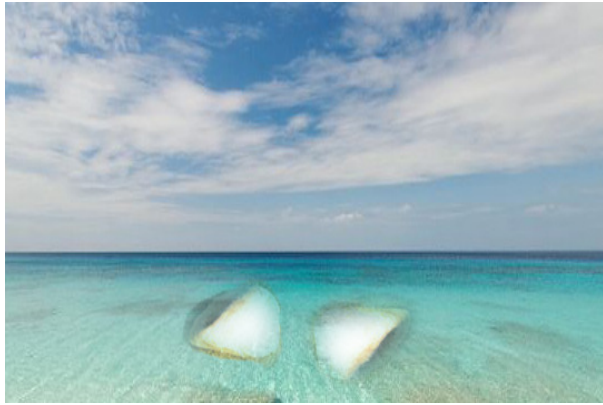
Dos piedras blancas en el mar

Narran que en tiempos del joven cacique Guacumao, hijo de Canimao y Cibayara, vivía una joven de belleza extraordinaria llamada Aibamaya. La joven tenía enloquecidos a los hombres del poblado de Yucayo, para quienes conquistarla era más importante que asumir las tareas que debían favorecer a la comunidad aborígen.