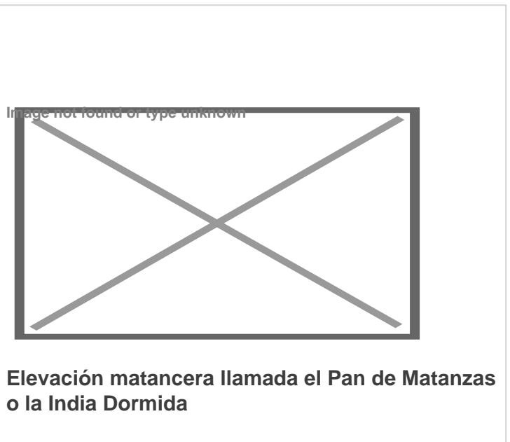
Elevación matancera llamada el Pan de Matanzas o la India Dormida

Al cacique Maguaní le preocupaba esta situación, ya que todas las actividades masculinas eran imprescindibles para el sostenimiento de la pequeña aldea. Decidió entonces dirigirse al río Canimao y desde allí hablar con su dios, Bagua, para rogarle ayuda y solución.