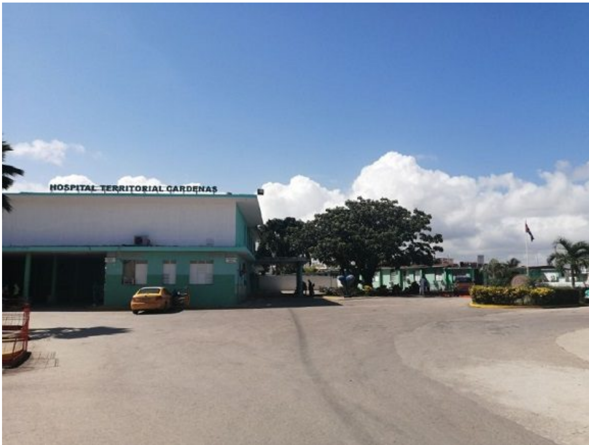
Hospital Territorial de Cárdenas "Julio Aristegui Villamil".

https://www.radiohc.cu/especiales/exclusivas/265257-aqui-estaremos-hasta-que-sea-necesario