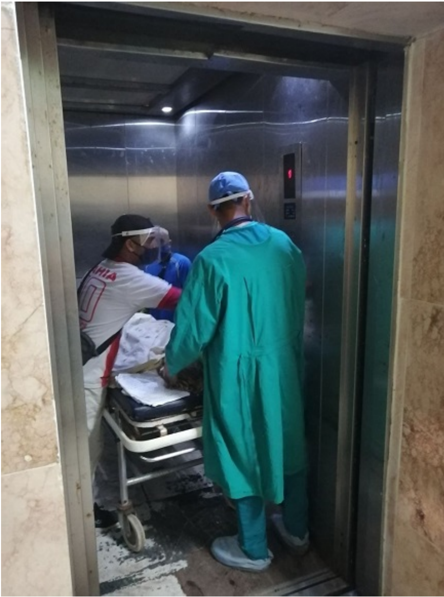
Traslado de una paciente hacia la terapia intermedia del hospital.

12:54 pm. Unidad de Cuidados Intensivos. Hospital Territorial de Cárdenas. Llega una ambulancia a la puerta de Emergencias. De las cuatro camas que hay en esta pequeña sala, dos quedan libres para la atención de cualquier urgencia. Nunca se sabe cuándo puede llegar un paciente grave.