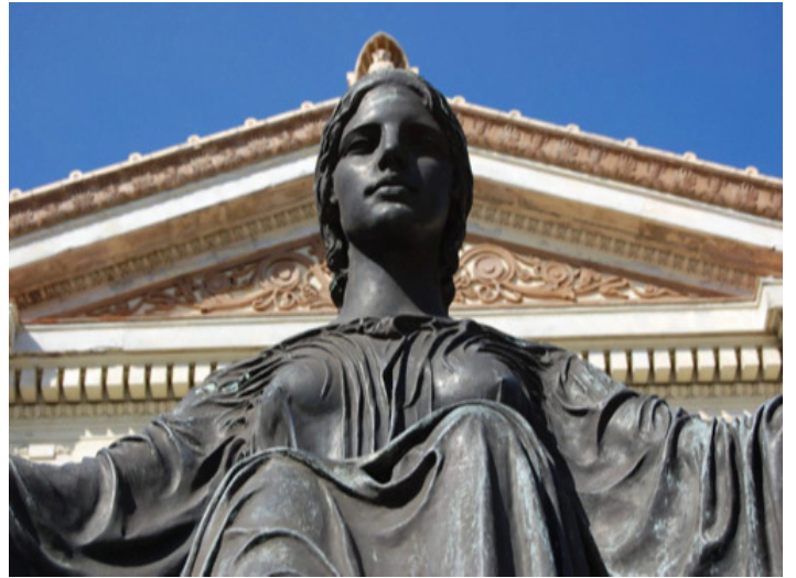
Gigantesca estatua del Alma Mater