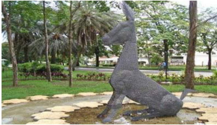
Escultura dedicada al Burro Perico

Las historias de Perico pasan de niño a niño en Cuba, de abuelos a padres y de estos a sus hijos.