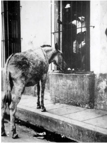
Burro Perico visitaba las casas

El respetado animalito, visitaba determinadas casas; con los cascotes, el hocico y los rebuznos avisaba de su presencia llamando a las puertas en busca de pan y de alguna fruta que fuera de su agrado.