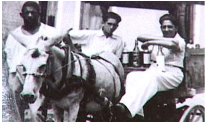
Burro Perico trabajando

Cuentan que su sepelio fue reseñado por la prensa y la radio nacionales, y, según la leyenda popular, hasta en el periódico norteamericano The New York Times se habló del suceso.