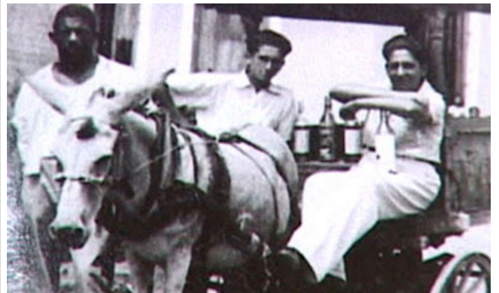
Burro Perico trabajando

Cuentan que su sepelio fue reseñado por la prensa y la radio nacionales, y, según la leyenda popular, hasta en el periódico norteamericano The New York Times se habló del suceso.