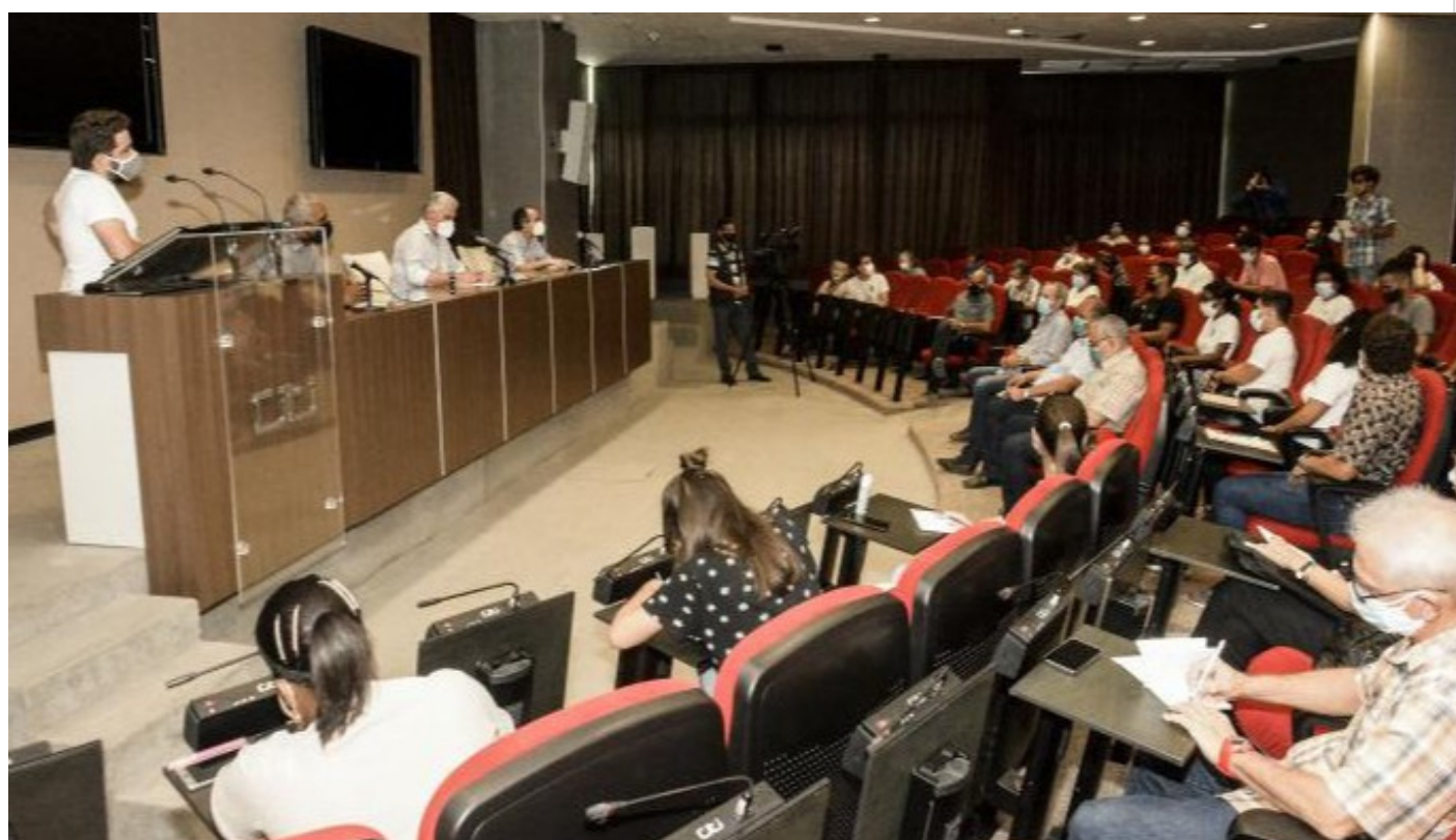
Encuentro de Díaz-Canel con estudiantes de la CUJAE.

La Habana, 21 ago (RHC)El Presidente de Cuba, Miguel Díaz-Canel Bermúdez, sostuvo este viernes un intercambio con estudiantes y profesores de la Universidad Tecnológica de La Habana «José Antonio Echeverría», CUJAE.