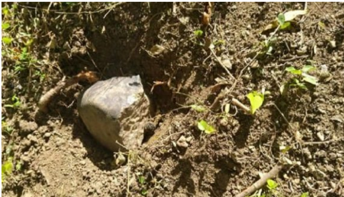
Fig. 1. Meteorito pétreo (Litito-Condrita), dentro de un pequeño cráter de impacto, en el lugar de caída

Las circunstancias de su caída descritas por los pobladores del lugar, primeramente por la aparición de una bola de fuego con una estela de humo en el cielo, seguidas de un ruido parecido a un trueno y finalmente, el avistamiento de su impacto en tierra, dejando un pequeño cráter, sirvieron como evidencias preliminares del posible origen cósmico de la roca colectada allí, por el equipo de especialistas del Citma de la oriental región.