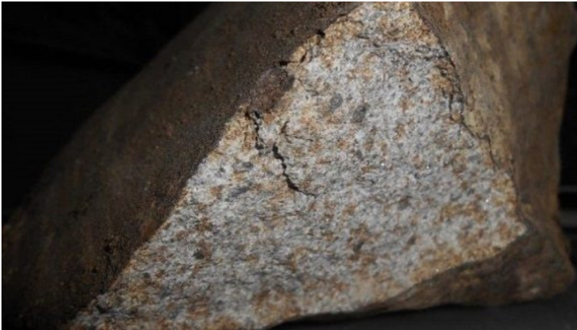
Cóndrulos en la matriz interior y corteza de fusión externa del meteorito.

La Habana, 2 sep (RHC) Expertos del Instituto cubano de Geofísica y Astronomía y de la Agencia de Medio Ambiente confirmaron tras el análisis realizado a la roca caída el 10 de julio de 2021 en el poblado Ramón de las Yaguas, del municipio Songo La Maya, provincia de Santiago de Cuba, que se trata de un meteorito pétreo, del grupo Lititos, perteneciente a la clase Condritas, con un peso total de 2,7 kg, una densidad aparente de 1,594 g/cm 3 y dimensiones de 13,7 x 12,9 x 9,8 cm.