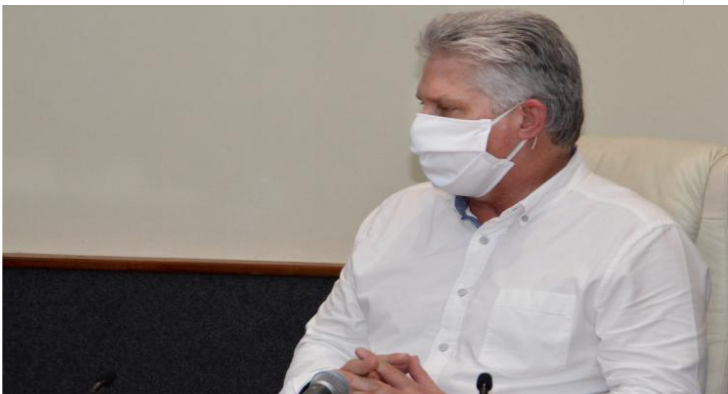
Presidente de Cuba, Miguel Díaz-Canel

La Habana, 4 sep (RHC) El presidente de Cuba, Miguel Díaz-Canel, a través de su cuenta en Twitter saludó este sábado los avances científicos del país para inmunizar a menores de edad contra la Covid-19.