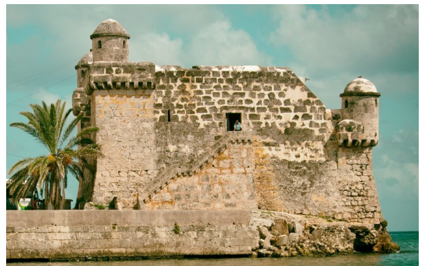
Torreón de Cojímar

Las construcciones serían de dos plantas, en la baja se alojaría la soldadesca y estarían las cuadras de los caballos, además del polvorín, la cocina y los almacenes, y en la alta estarían las áreas destinadas a la defensa, además de los aposentos de la oficialidad y algunas dependencias de carácter administrativo. En la azotea, una pequeña torrecita circular albergaría la posta de los vigías, mientras que el fortín de Cojímar