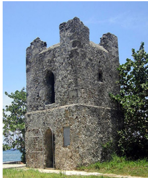
Torreón de Bacuranao

No sobrevivió a la toma de La Habana por los ingleses, pues fue arrasado por la artillería de las fragatas británicas Mercury y Bonetta como preparación de fuego del desembarco de las tropas británicas, el 7 de junio de 1762.