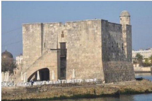
Torreón de La Chorrera

las autoridades coloniales prohibiendo todo tránsito por la zona de personas, animales y vehículos, de donde le vino a esta su nombre actual de El Vedado.