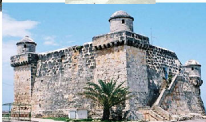
Vigías de piedra