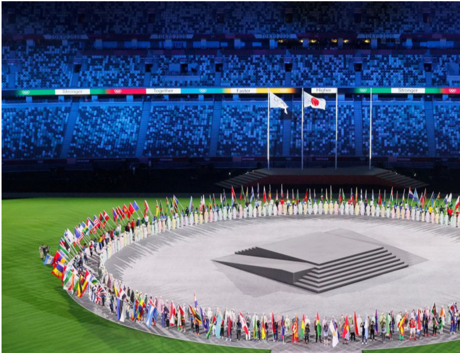
Ceremonia de clausura de los Juegos Paralímpicos Tokyo 2020.

https://www.radiohc.cu/noticias/deportes/269129-clausurados-los-juegos-paralimpicos-fin-de-una-saga-de-8-anos