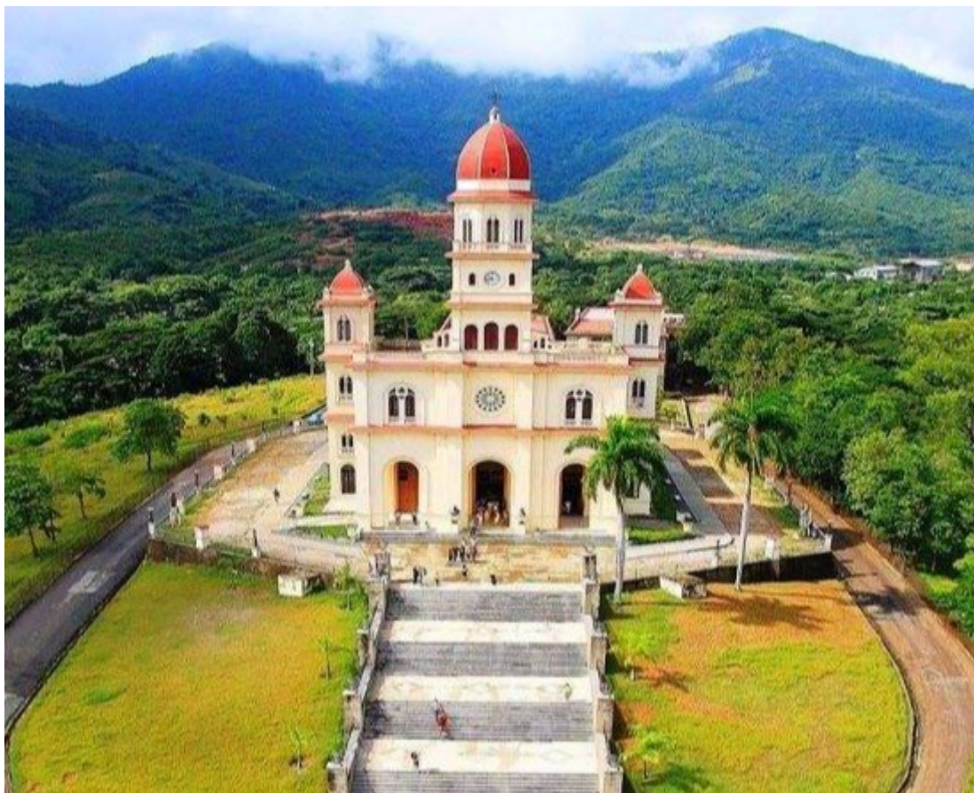
El Santuario de la Virgen del Cobre.

Santiago de Cuba, 8 sep (RHC) El Santuario de Nuestra Señora de la Virgen de la Caridad del Cobre es uno de los sitios religiosos más venerados por los cubanos.