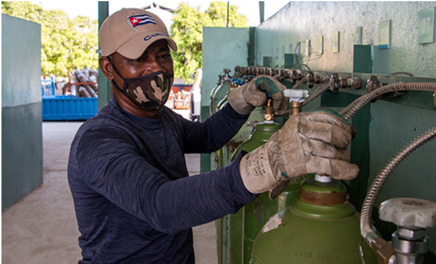
Jornada de trabajo en Gases Industriales de Cuba.

Luego del envase se van cubriendo necesidades por territorio. “Lo mismo tienes que llevar de Matanzas para Cienfuegos, que de Sancti Spíritus para Villa Clara, que de Camagüey para Las Tunas”, precisó la directora general de Gases Industriales.