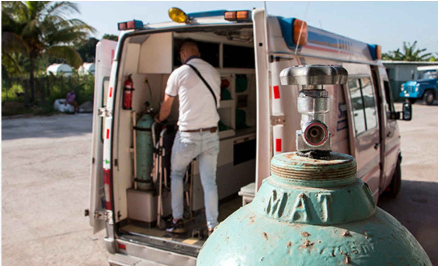
Gases Industriales de Cuba.