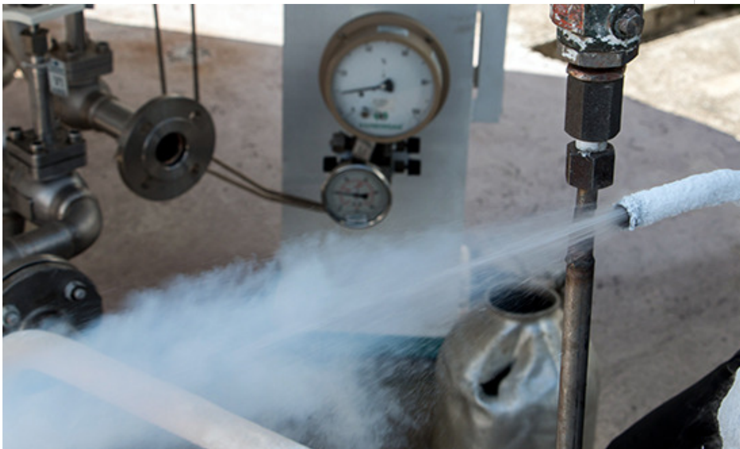
Oxígeno líquido.