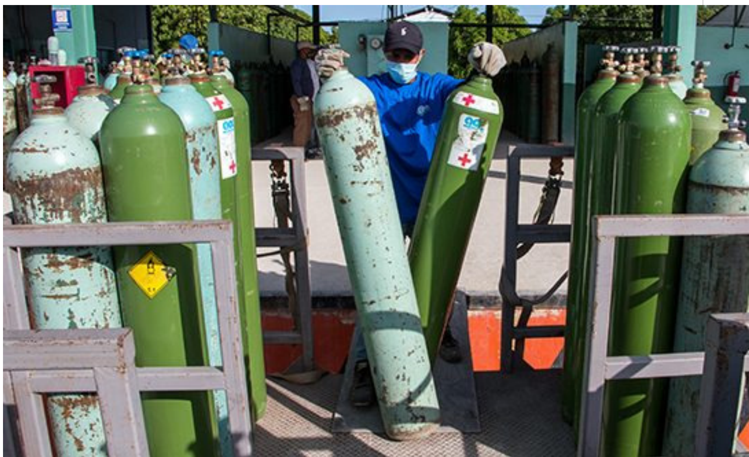
Jornada de trabajo en Gases Industriales de Cuba.