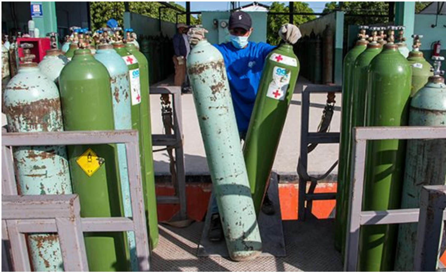
Jornada de trabajo en Gases Industriales de Cuba.