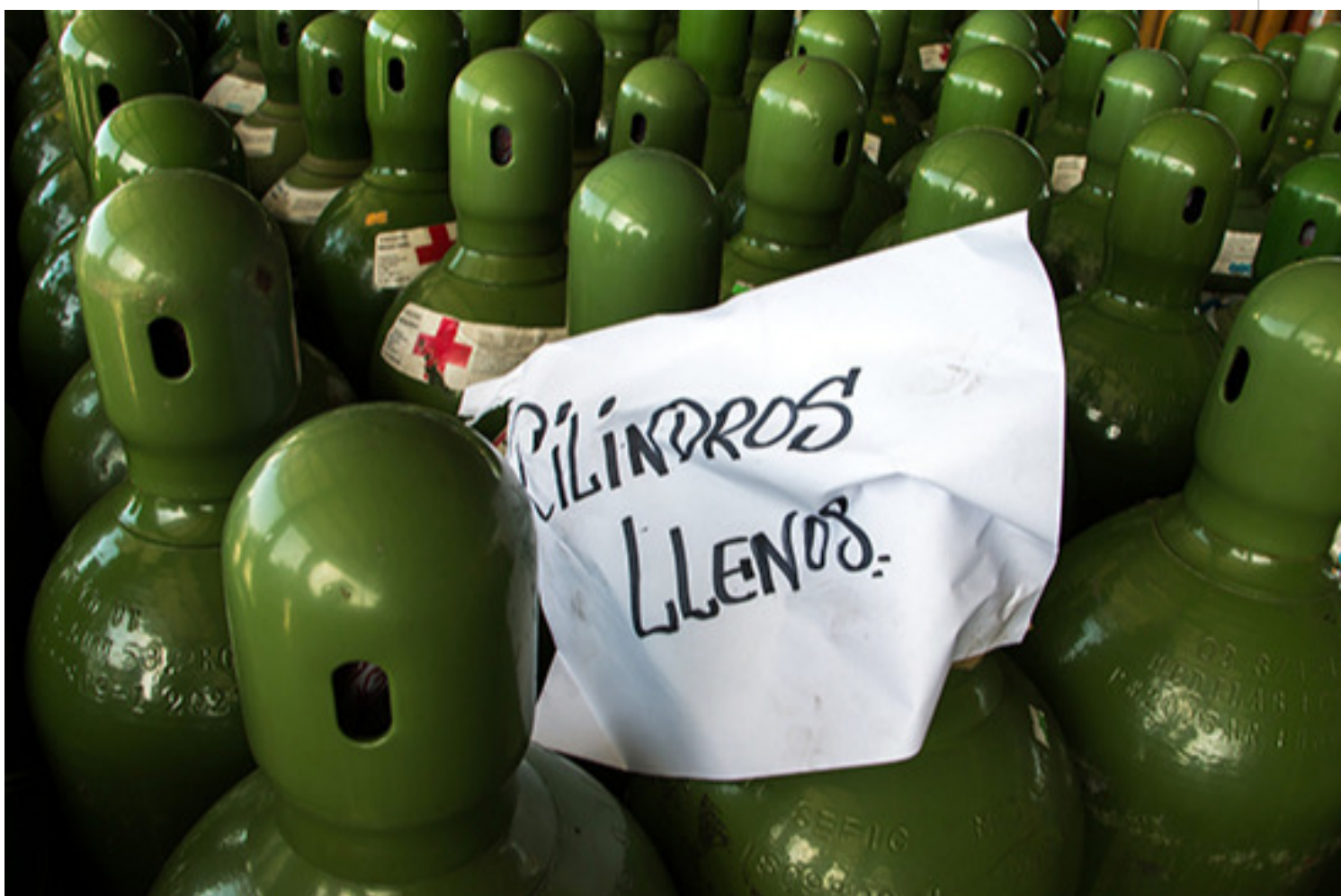
Jornada de trabajo en Gases Industriales de Cuba.

Luego de 100 días de heroicidades y angustias, Cuba se encuentra terminando el ajuste y la puesta en marcha, logrando ya producciones importantes para el sistema de salud, de la planta de gases industriales OxiCuba S.A., que concentra el 95% de la producción de oxígeno líquido en el país y es capaz de producir por encima de la demanda diaria.