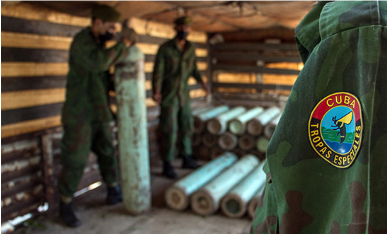
Fuerzas del Ministerio del Interior ayudan en la repartición de cilindros de oxígeno.